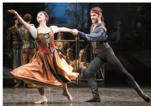
《海盜》的異國情調、刺激情節及高難度動作，使其成為百年經典。

日期：3月15至16日 時間：晚上7:30 日期：3月16至17日 時間：下午2:30 地點：香港文化中心大劇院 門票：HK$340至HK$1180 內容：根據英國詩人拜倫同名詩作改編的芭蕾舞劇《海盜》，十九世紀首演以來歷演不衰，編舞紛紛改編重排，當中以「古典芭蕾之父」佩蒂巴的版本最受注目。今屆香港藝術節帶來米蘭史卡拉歌劇院芭蕾舞團的《海盜》，此劇為舞團總監魯格里斯根據佩蒂巴版本改編而成，在保留原版經典場面之餘，還加入多場大型群舞，配以華麗舞台與服裝設計，適合大小觀眾觀賞。《海盜》講述俠盜康拉德率領一群海盜來到土耳其，並遇上奴隸少女美多娜，兩人一見鍾情。康拉德帶她回海盜巢穴，又同意她的請求釋放奴隸，但惹來副手不滿並引發叛變，連場打鬥為舞劇掀起幕幕高潮。記者：Ruth