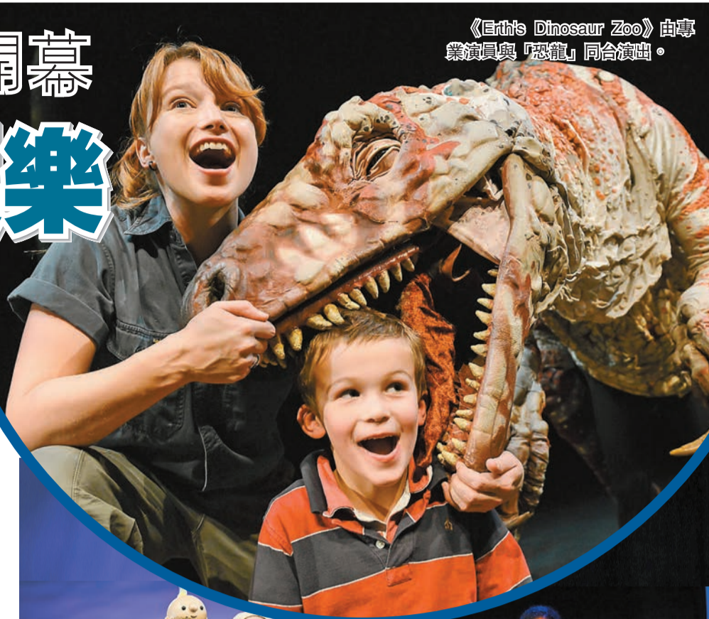
《Erth's Dinosaur Zoo》由專業演員與「恐龍」同台演出。