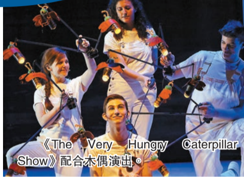
《The Very Hungry Caterpillar Show》配合木偶演出。