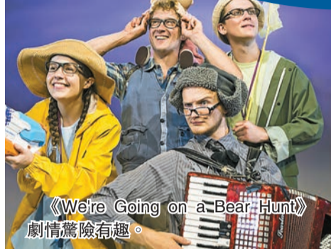
《We're Going on a Bear Hunt》劇情驚險有趣。