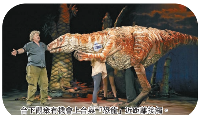
台下觀眾有機會上台與「恐龍」近距離接觸。

《Erth's Dinosaur Zoo》曾經在2016年來港上演，當時大受歡迎。節目由現場觀眾與台上「恐龍」互動，在主持引領下，台下小朋友可以在互動環節踏上舞台，親手餵飼及觸摸栩栩如生的「恐龍」。「恐龍」像真度極高，令現場驚喜連連。劇場會出現可愛的恐龍BB，也有曾經統治地球的大型草食和肉食恐龍，還包括昆蟲與哺乳類動物等。台上主持會引領台下大人小朋友進入一個恐龍樂園，過程緊張刺激。通過近距離與遠古時代的生物接觸，小朋友可以增進古生物學及環保知識，兼體驗成為表演者一分子的樂趣。