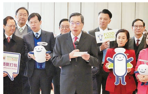
梁君彥(前排中)與議員支持「惜食體驗」活動。記者 林駿強攝

【香港商報訊】記者林駿強、實習記者邱之璘報道：立法會昨日舉行惜食體驗活動，多位立法會議員在特首交流問答會結束後，共同前往會廳食用剩餘食物製成的餐盒。立法會主席梁君彥呼籲香港市民力行食物節約，為香港環保事業作出貢獻。