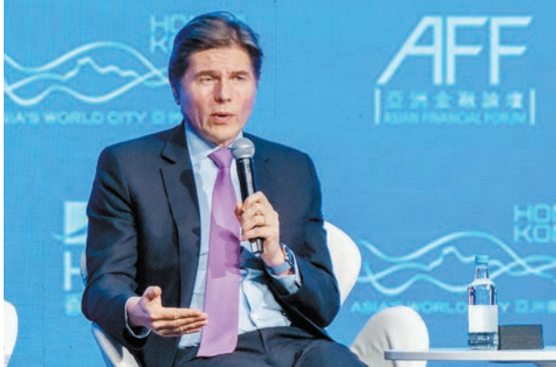
歐冠昇歡迎內地下調存款準備金率等穩定市場措施。