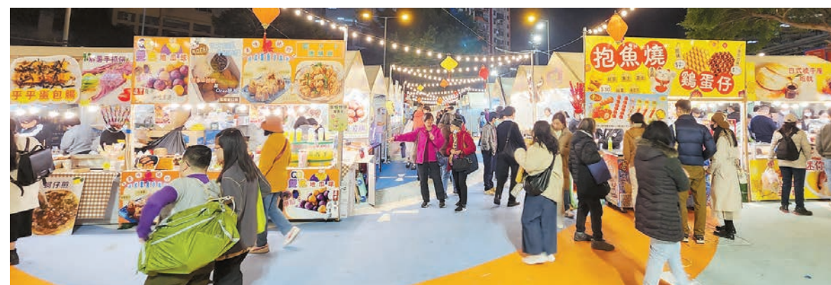
龍騰觀塘新春夜市首日開幕，吸引不少市民到場夜遊品嘗小吃及購物。

售賣年花的檔主表示，自己身兼旅行社的工作，因為現時旅遊業的大環境不理想，很難單靠旅行社的收入生活，所以希望多元化嘗試不同工作。她指由於這類市集屬於臨時性質，遊客往往不知道有活動，希望當局長期舉辦夜繽紛活動，吸引遊客。