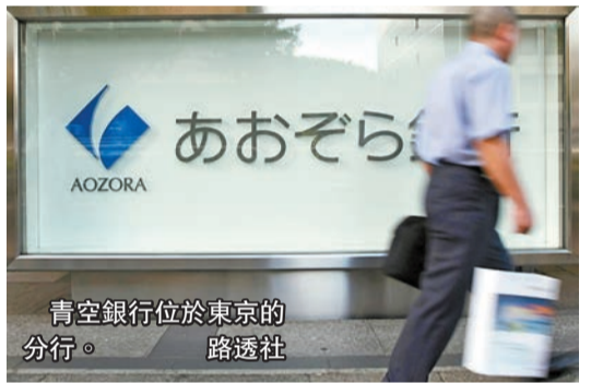
青空銀行位於東京的分行。

青空銀行表示，已經對物業估值進行了審查，並通過額外撥備增加了儲備金，以便為可能出現的債務重組做好更充分的準備，包括通過出售相關物業資產進行債務追收。該行認為，市場可能還需要一兩年才能穩定下來。