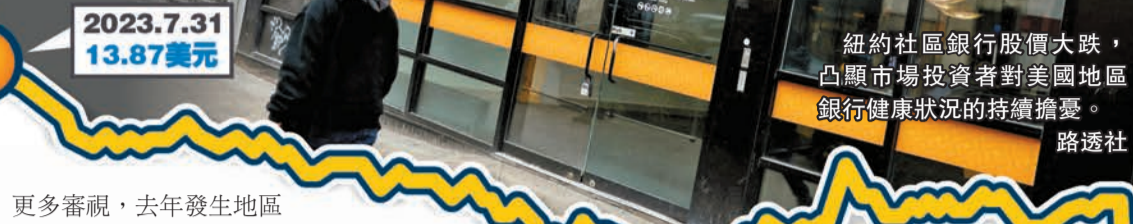
紐約社區銀行股價大跌，凸顯市場投資者對美國地區銀行健康狀況的持續擔憂。