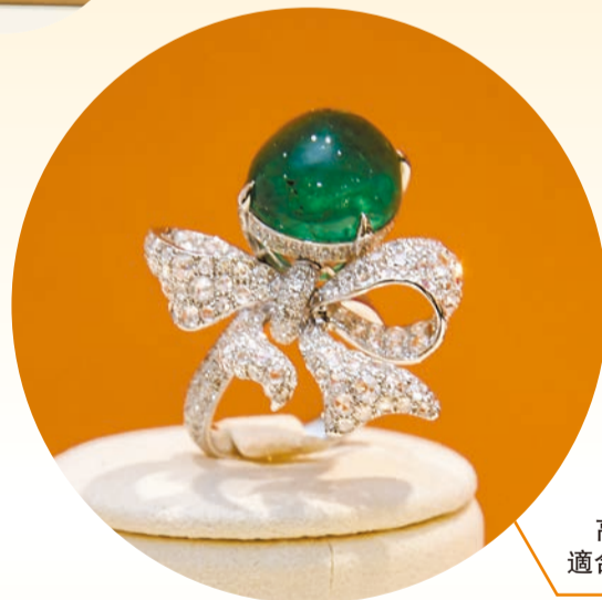
高雅的綠寶連蝴蝶鑽戒，適合隆重場合佩戴。