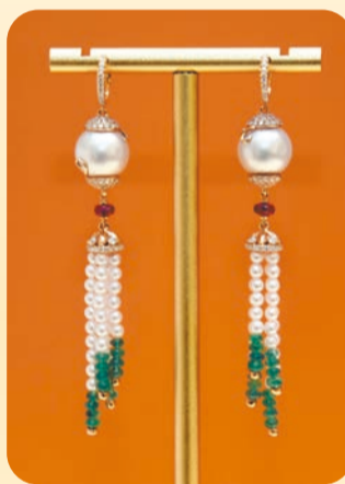
珍珠吊墜耳環，佩戴後優雅及有動感。