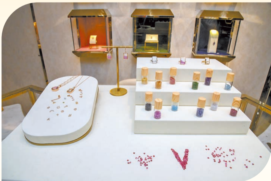
利園與Verde Jewellery攜手推出特別限量版的「Rainbow Locket」，邀請堪輿學家現場講解新年運程，並以不同顏色的寶石配合個人磁場，增強新一年的能量。