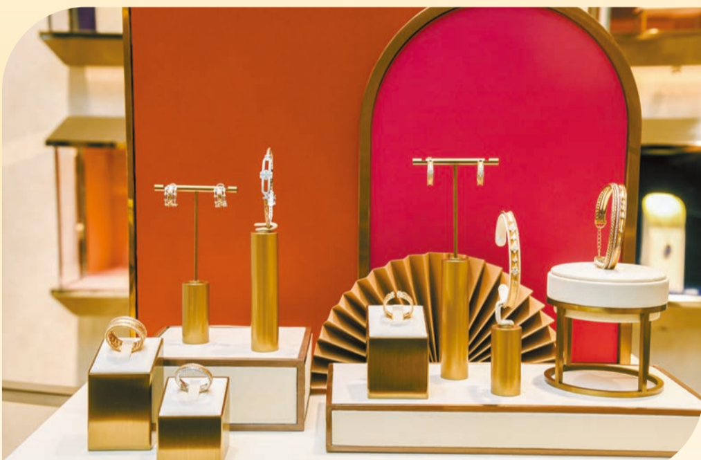
意大利工藝級珠寶系列。