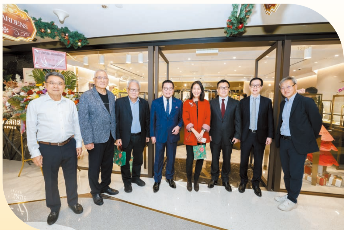
一班政商界好友來支持。