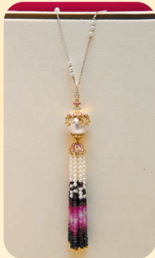
珍珠吊墜款式的流蘇頸鏈，顏色鮮艷，造型配搭大方。