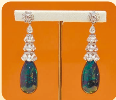
高級珠寶收藏系列的水滴形綠寶耳環價值88萬元，附有證書，材質通透立體，市面造工難求，升值潛力甚高。