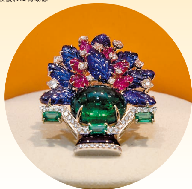
綠寶連紫、粉紅寶石，顏色相得益彰。