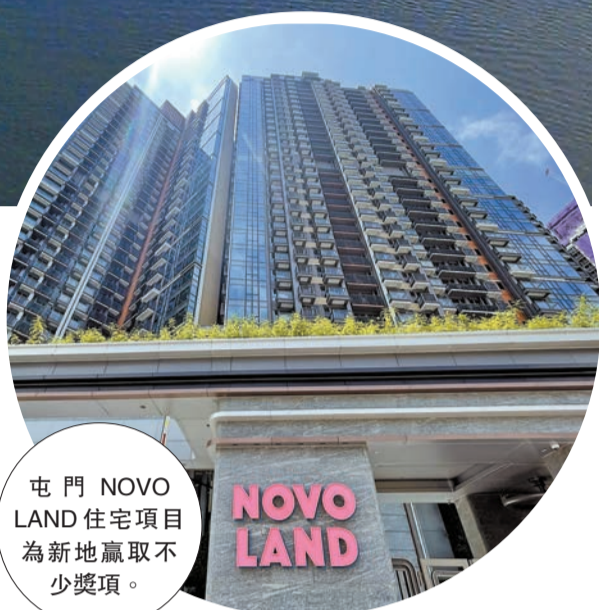
屯門 NOVO LAND 住宅項目 為新地贏取不少獎項。

成的商廈 The Millennity，落成不久也吸引不少金融監管機構、創科公司、零售品牌等租戶進駐，與項目獲得 BEAM Plus、LEED、WELL 認證不無關係。