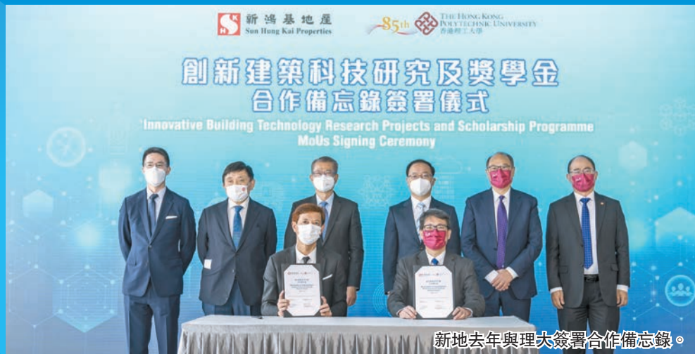
新地去年與理大簽署合作備忘錄。

新地多年來透過「新閱會」，積極向青少年推廣愉快閱讀，近年更致力將閱讀與 STEM 結合。新地在去年暑假期間贊助了 2000 名學生遊香港書展及購買與中華文化及 STEM 相關的書籍，鼓勵學生透過閱讀接觸中華文化及歷史、了解不同的科普知識，其中 800 名學生來自深水埗等地區。