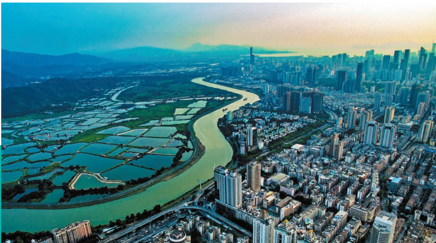
作為大灣區內高度開放和國際化的城市，香港在大灣區建設中扮演了極其重要的角色。圖為河套港深創新及科技園一帶。

建設粵港澳大灣區，是習近平主席親自謀劃、親自部署、親自推動的重大國家戰略。2019年2月18日，《粵港澳大灣區發展規劃綱要》（下稱《綱要》）正式公布，拉開了大灣區建設轟轟烈烈的進程。5年來，在粵港澳三地政府和各方的積極努力下，大灣區建設如火如荼，日新月異，在基礎設施、投資貿易、金融服務、科技教育等領域，都取得了一系列舉世矚目的發展成就。