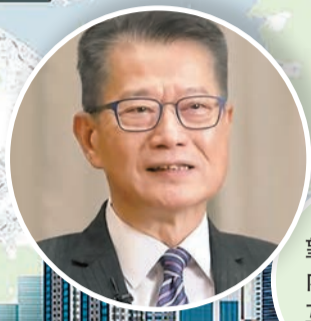
陳茂波期望擴大深化與內地市場互聯互通。影片截圖

陳茂波早前出席瑞士達沃斯世界經濟論壇年會，了解到眾多投資者都非常看好中國內地和亞洲區發展的機遇和潛力。他躊躇滿志地說，「未來香港除了要發揮好超級聯繫人的作用外，還要做好一個橋樑的角色。」讓世界了解到「原來這裏生機勃勃，有很多機會。」接下來，特區政府會舉辦很多盛事，吸引更多國際人士來到香港。「廣交天下朋友，這是香港國際化的特色」。