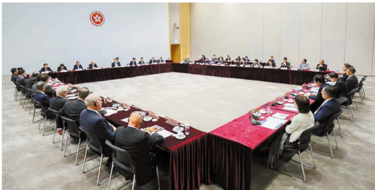
夏寶龍與香港企業家代表座談。

誠，感覺到夏寶龍是為議員打氣，並就香港發展給予清晰信息，只要議員努力提出不同意見，國家都會全力支持。她形容自己充滿信心，希望大家在未來一年團結一致。