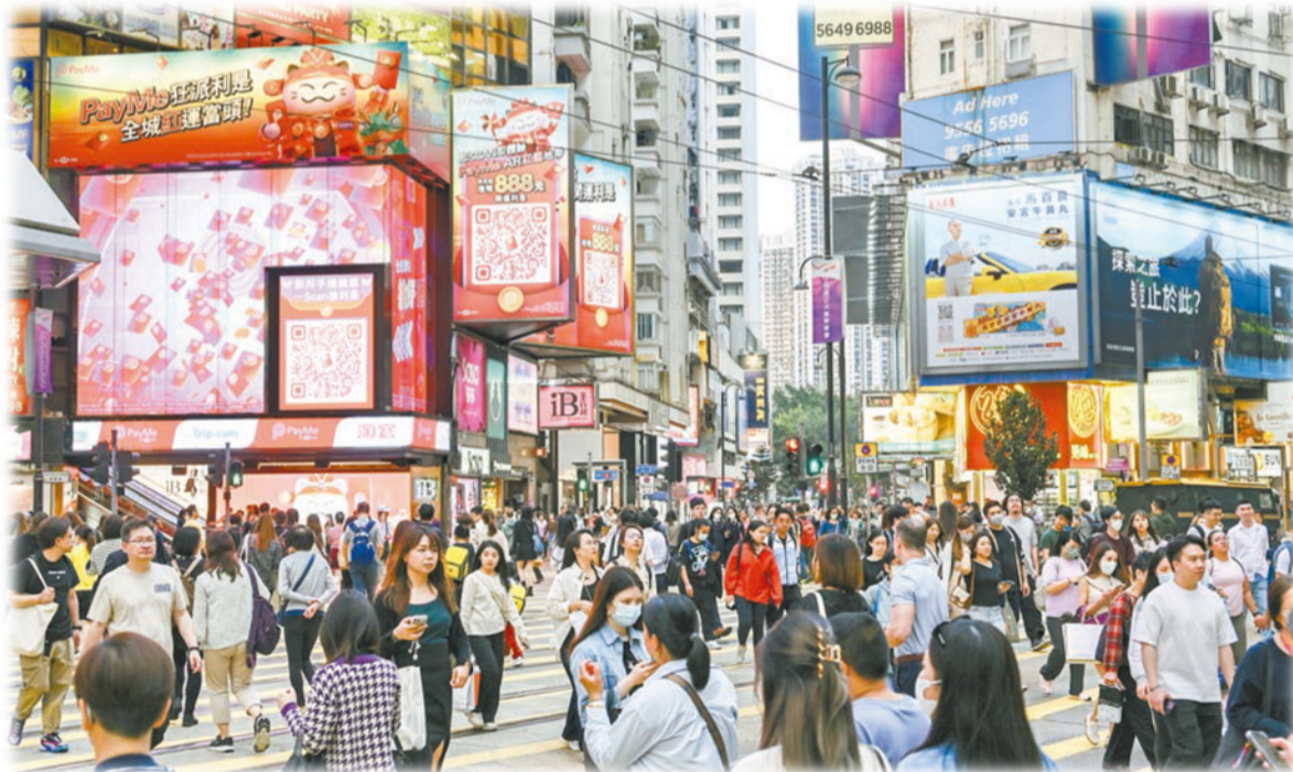
當局表示，香港業界已準備配套措施，歡迎西安、青島兩個地方的民眾來港旅遊。中新社

文化體育及旅遊局局長楊潤雄則表示，今次措施對香港旅遊業發展有積極提振作用，香港將發揮好客之道，讓旅客賓至如歸，感受香港的獨特文化色彩。本港將繼續致力提升旅客承載能力，確保口