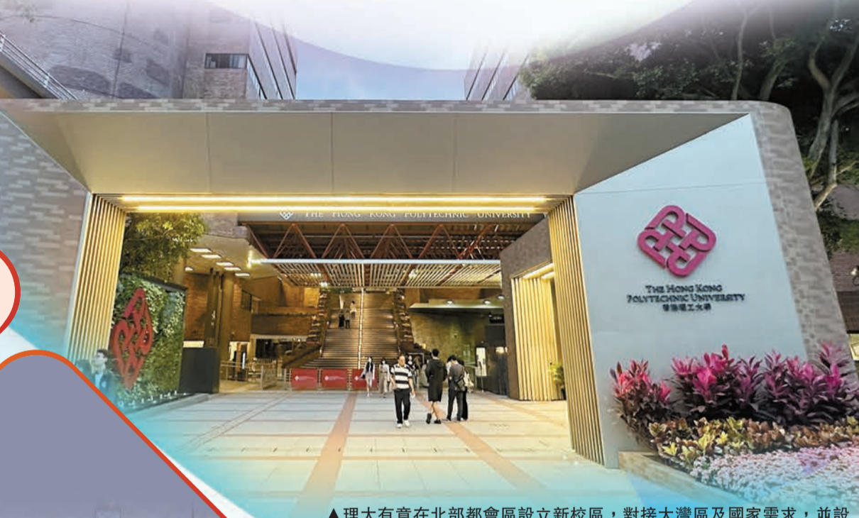
▲理大有意在北部都會區設立新校區，對接大灣區及國家需求，並設立研發基地及大型科研設施、醫學院等，匯聚及培育更多科研人才。