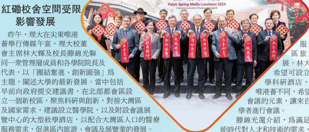
香港理工大學甲辰年新春傳媒午餐 創新「理」程30年誌慶 PolyU Spring Media Luncheon 2024