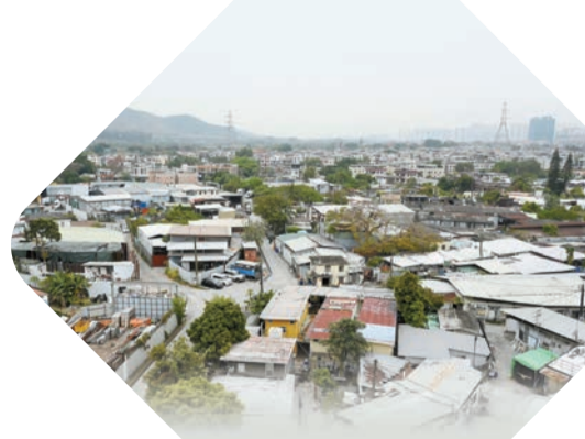
去年施政報告中提到，將洪水橋發展成物流樞紐及「北都大學教育城」。

因應北部都會區發展大學教育城，浸會大學早前表示，有興趣將部分或整個校園遷入北都大學教育城，而且去年8月就已向教育局及教資會表達意向，期望北部校園交通便利、面積比現時更大。浸大校長衛炳江表示，九龍塘浸大校園空間資源其實已非常緊張，有教授希望擴展工作室或實驗室亦