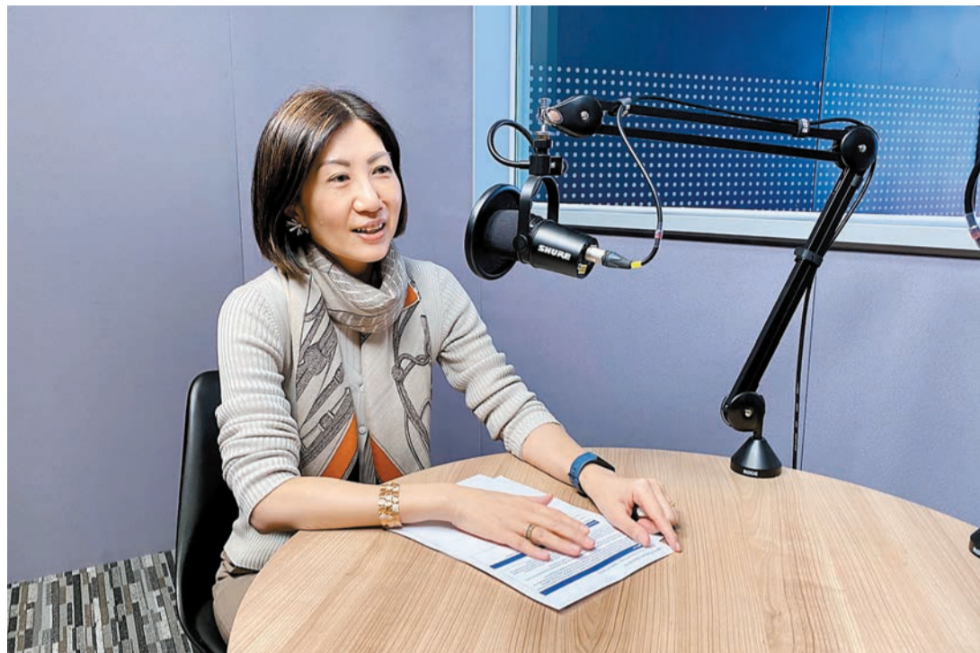
港交所史上首位女性行政總裁陳翊庭，向員工發信表示，未來有三大重要發展機遇。

陳翊庭現年54歲，擁有香港大學法學學士學位及美國哈佛法學院法學碩士學位。她曾出任港交所上市科首次公開招股交易部主管；2010年至2019年期