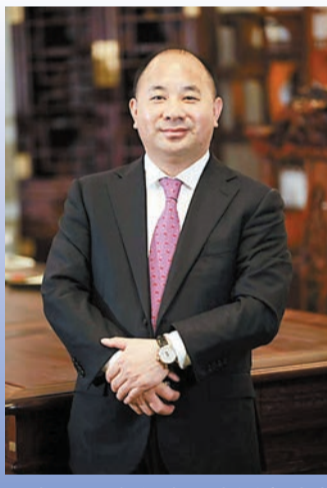
在2021年福布斯中國內地富豪榜中，王文銀是排名第25位的超級富豪，當時他53歲，坐擁1179億元財富。

值得注意的是，王文銀與中國恒大集團主席許家印私交甚密。他曾經送過一首藏頭詩給許家印，誇讚對方「卓越且偉大」。根據公開報道，王文銀於2017年以50億元入股恒大地產，而在中國恒大流動性危機初現時，王文銀2020年9月現身恒大戰投簽約儀式，以863億元資金力挺許家印。