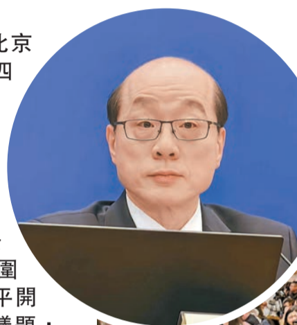
◀全國政協大會新聞發言人劉結一昨日首次主持政協新聞發布會。