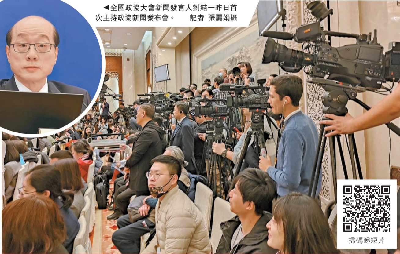
作為全國兩會首場發布會，全國政協十四屆二次會議新聞發布會吸引眾多中外媒體關注。