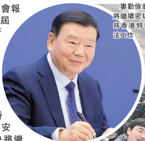
婁勤儉表示，全國人大將繼續密切關注、全力支持香港特區做好23條立法工作。

【香港商報訊】兩會報道組北京報道：十四屆全國人大二次會議新聞發布會昨日在人民大會堂舉行。大會新聞發言人婁勤儉在答港媒記者問時表示，盡早完成香港基本法規定的維護國家安全立法，是香港特區履行維護國家安全的憲制責任。中央將繼續支持香港積極融入國家發展大局，主動對接國家發展戰略，發揮好在國際國內雙循環中的樞紐作用。尚有相關報道刊A11、A12版