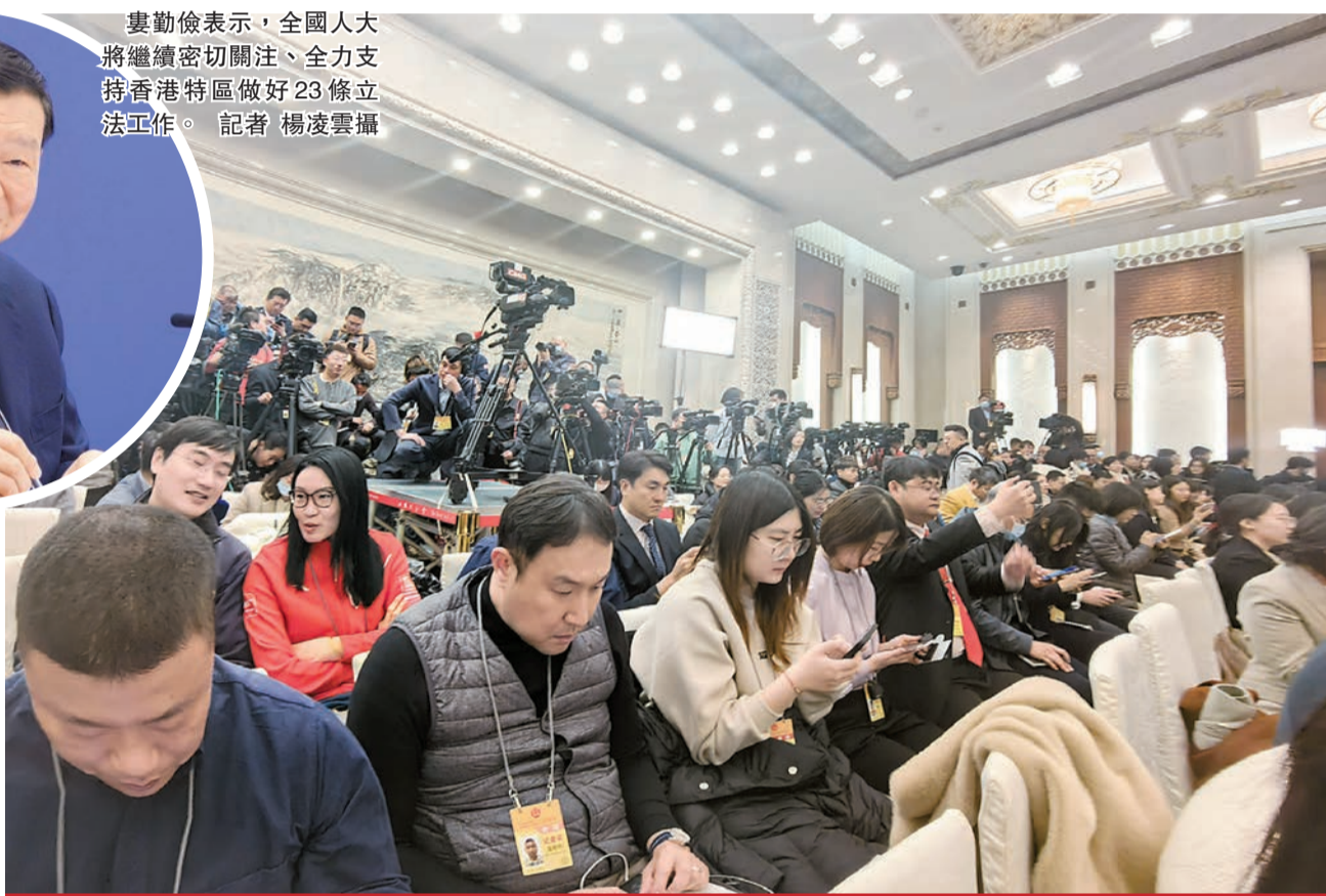
3月4日，十四屆全國人大二次會議在人民大會堂舉行新聞發布會。