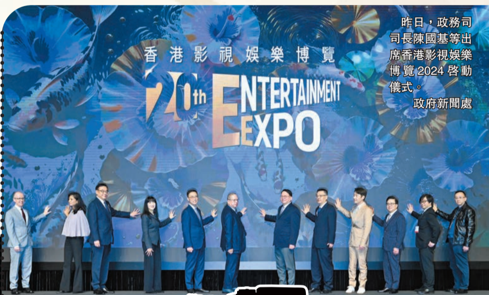
昨日，政務司司長陳國基等出席香港影視娛樂博覽2024啓動儀式。政府新聞處

【香港商報訊】記者余樂祖、姚一鶴報道：作為特區政府「藝術三月2024」的頭炮活動之一、由香港貿發局主辦的香港影視娛樂博覽昨起一連四天在灣仔會展中心舉行，涵蓋10項影視娛樂活動（詳見列表）。昨日，香港國際影視展及亞洲影視娛樂論壇啓動，活動雲集業界領袖及環球展商，展示最新影視作品和科技，分享環球業界議題，促進業界拓展國際市場新機遇，進一步促進香港發展成為中外文化藝術交流中心，鞏固香港作為區域知識產權貿易中心的角色。其間，阿里大文娛集團更拋出「震撼彈」，未來5年至少投入50億元，聯合其他本港文化娛樂公司共同推進「港藝振興計劃」，阿里影業也將在港打造第二總部。