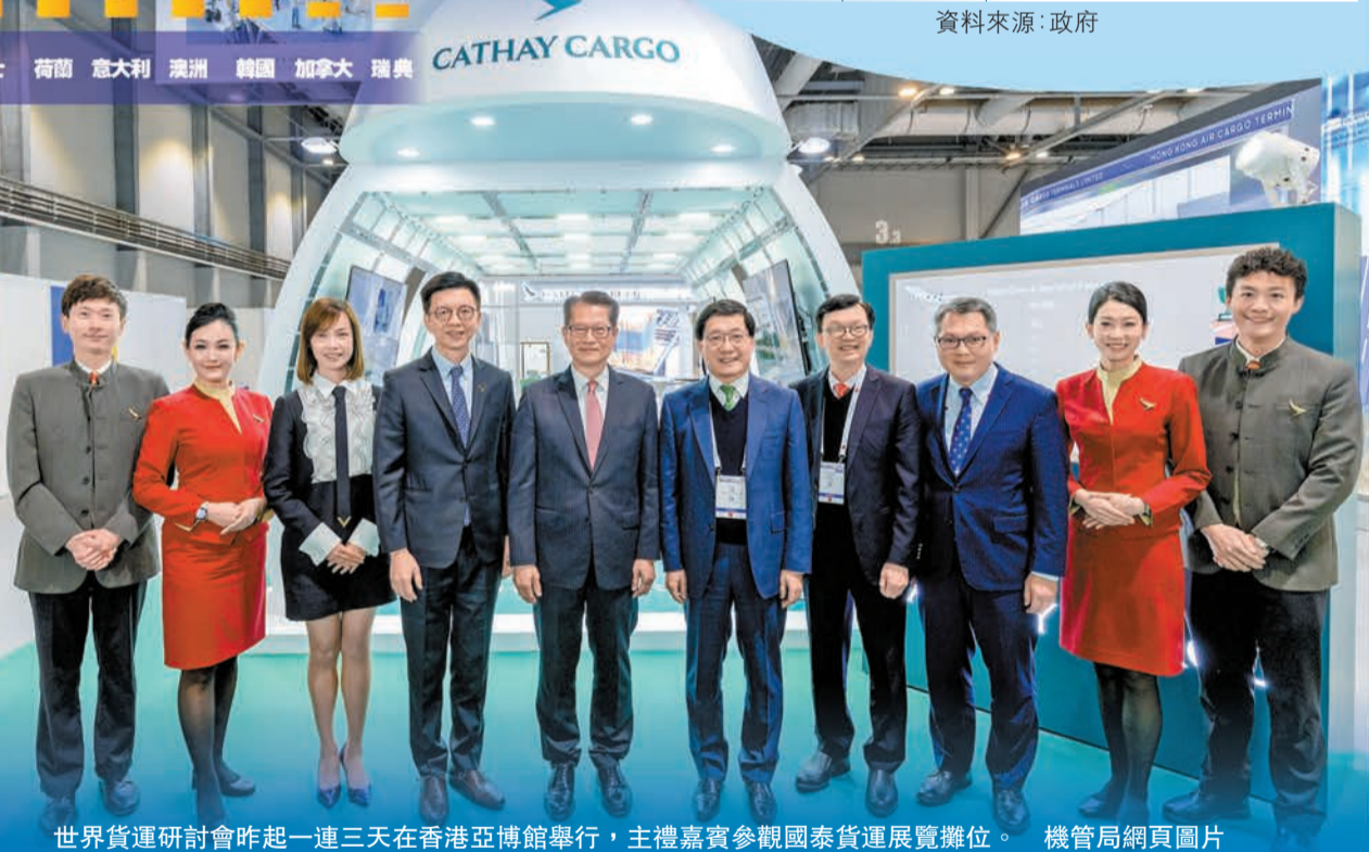
世界貨運研討會昨起一連三天在香港亞博館舉行，主禮嘉賓參觀國泰貨運展覽攤位。