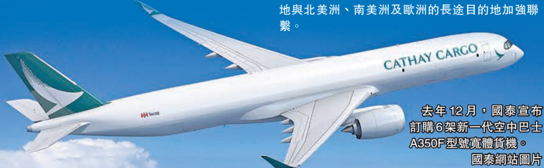
去年12月，國泰宣布訂購6架新一代空中巴士A350F型號寬體貨機。國泰網站圖片

國泰表示，A350F貨機是全球技術最先進的貨機，此貨機的機身採用的是堅固而輕量的複合物料和鈦金屬，不僅可提供更高的燃油效益，操作亦更簡便。購入此款貨機，有助進一步鞏固香港的全球第一航空貨運樞紐地位，亦有助香港和內地與北美洲、南美洲及歐洲的長途目的地加強聯繫。