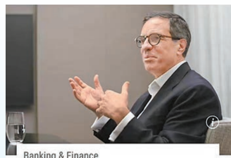
Banking & Finance

摩根大通，又稱「小摩」，總部位於美國紐約市，業務遍及50多個國家，全球擁有約32萬名員工，資產規模計算為美國最大的金融服務機構。今年1月該行公布去年業績，年利潤超過美國銀行業歷史上任何一家銀行。去年全年該行錄得盈利496億美元，較2022年增長32%，較2021年突破的創紀錄值的483億美元也要高。美國六大銀行直到2018年才達到1000億美元的年利潤，而摩根大通在2023年幾乎達到了這一數字的一半。