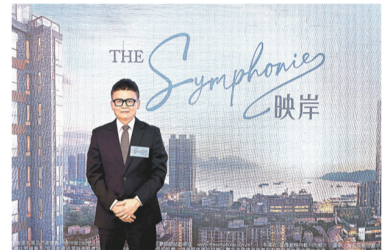
林達民表示，映岸已經取得滿意紙，項目約有一半單位可望見海景。

另外，長實(1113)、港鐵(066)合作發展的黃竹坑站上蓋項目港島南岸第3期Blue Coast下星期將上載樓書。而王新興集團牛頭角泰峯，市場消息指，截至昨日下午六時，項目已收6000票，按首批公開發售單位336伙計算，超額約16.8倍。