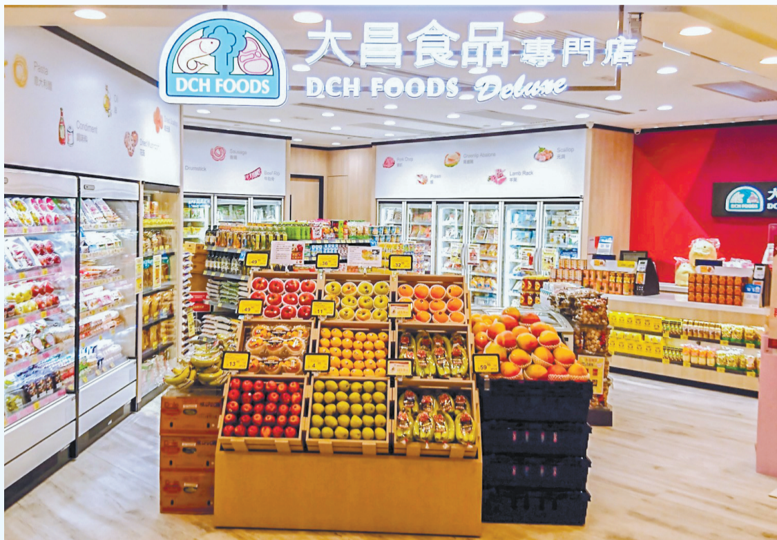
大昌食品市場指，受到不確定的外在因素和各種營運挑戰，決定終止食品市場業務。

據悉，大昌行昨早與員工開會交代。該公司通知書指，就員工4月的工資、未放取的年假，以及其他法定權益等，將於最後受僱日期後的7日內發放。另外，公司將向員工發放相當於一個月基本薪金的「特惠金」，以令過渡期的程序和工作順利完成，不過，強調「特惠金」屬酌情性獎金，是否發放交由管理層決定。通知書又提醒員工未等到公司書面批准，不可向外界洩露公司專有或機密資料。大昌行回覆本地媒體查詢指，經過慎重考慮後，決定關閉28間食品零售店舖，但未透露營運日子。大昌行指，作為香港最大的食品及快速消費品分銷商，將繼續為香港市場提供優質的採購、分銷以及食品加工等業務，以滿足本地社區和消費者的需要。