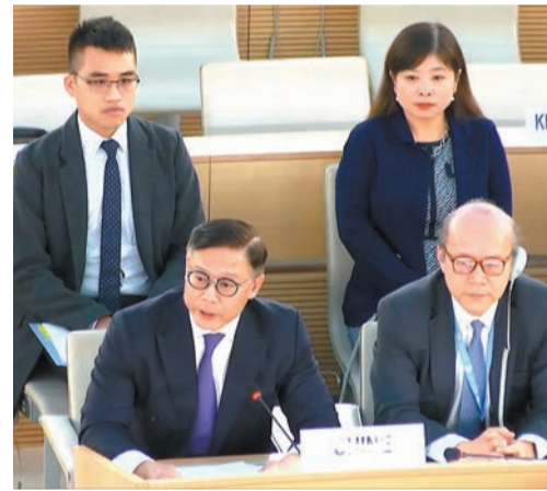
律政司副司長張國鈞（前排左）在瑞士日內瓦出席聯合國人權理事會第55屆會議，就維護國家安全條例草案立法發言。

張國鈞作為中國代表團成員出席聯合國人權理事會第55屆會議並同有關方面進行交流，促進國際社會對維護國家安全條例立法工作的理解和支持。