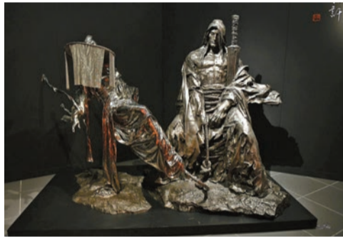
任哲雕塑作品，《神鵰俠侶》主角《楊過》及《小龍女》。