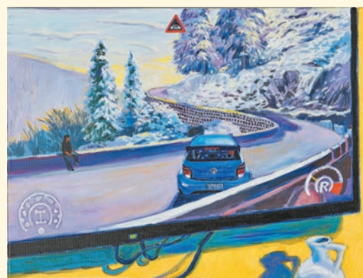
黃進曦《電玩風景：家中的蒙地卡羅》，2024。