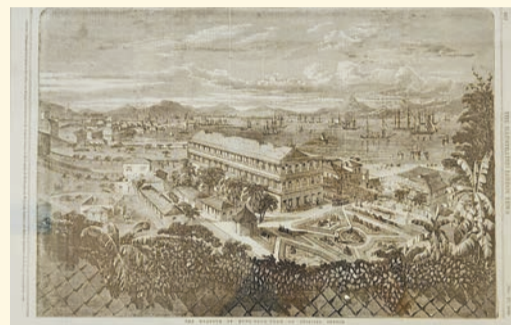
展品《倫敦新聞畫報》畫作，描繪了1857年維多利亞城中區的面貌。