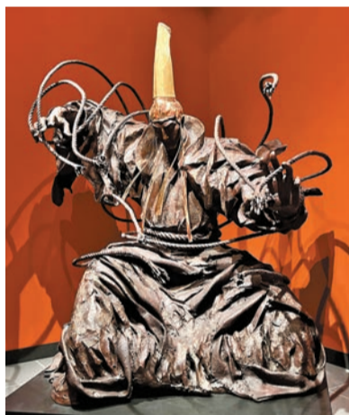
任哲雕塑作品《東方不敗》。