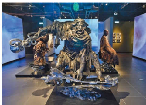
任哲雕塑作品《歐陽鋒》。