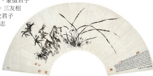
啓功作品《三友圖》，水墨紙本，190×61cm。

蕭暉榮是啓功生前之忘年交，啓功於蕭教授亦師亦友，常一同探研藝事。蕭教授購得此「啓功先生妙墨神品」後非常歡喜，題長跋說明因由，並高度讚揚啓功的高超藝術造詣及高尚品德：「癸巳（2013年）歲秋，幸於京中『宣和鑒目 筆底龍蛇』中國古代書畫鑒定組五老作品，由先生家屬友情提供之專場中，投得此佳構，重金所得也。然能此特大扇面歸藏，如獲至寶，珍之甚也。晚生與啓老訂交於上世紀八十年代，先生之治學和為人堪稱德高望重，於書法藝術上造詣高超。而其精湛之鑒賞功力和終生深入對古文化之研究，不單為民族傳統優秀藝術之傳承弘揚貢獻良多，同時對其在繪