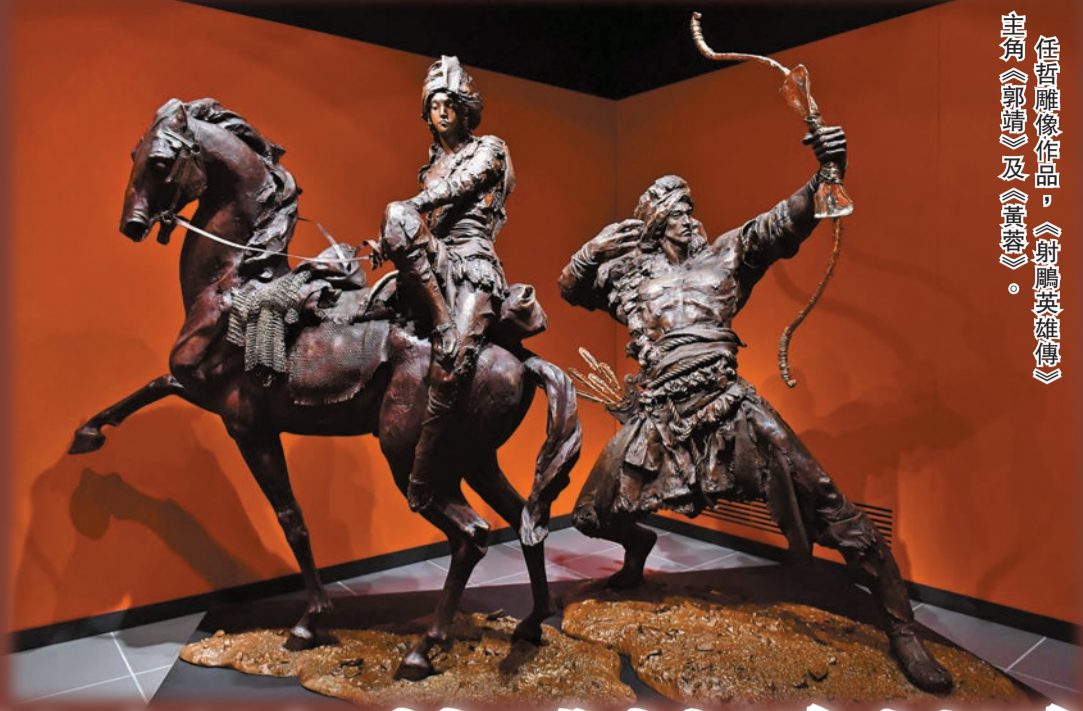
任哲雕塑作品，《射鵰英雄傳》主角《郭靖》及《黃蓉》。