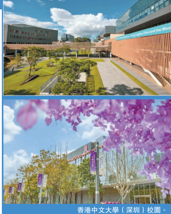
香港中文大學（深圳）校園。

當前，港中大（深圳）在機器人與人工智能、生物信息學、新材料和能源科學、國際金融與物流、製藥和精準醫學等重點研究領域，成立了82個國際水準的研究院和重點實驗室，承擔超過370個國家級項目和超過1000個國際各類項目。