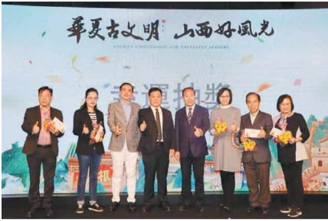
山西文旅（香港）專題推介會現場。

本次推介會由山西省文化和旅遊廳主辦，是2024晉港直航啓動暨山西文旅（港澳）推廣活動的首站，旨在以香港為窗口宣傳展示山西文旅資源、持續深耕粵港澳大灣區文旅市場，是晉港兩地深入交流、凝聚共識、共謀合作的重要舉措。