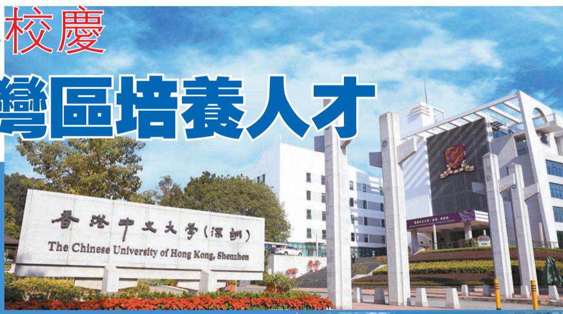
香港中文大學（深圳）校門。

十年風華，融匯創新。港中大（深圳）充分發揮中外合作辦學的制度優勢，發揮香港「一國兩制」和深圳「雙區建設」的獨特優勢，傳承港中大「結合傳統與現代，融會中國與西方」的辦學理念，致力為國家創辦一所國際化世界一流研究型大學。