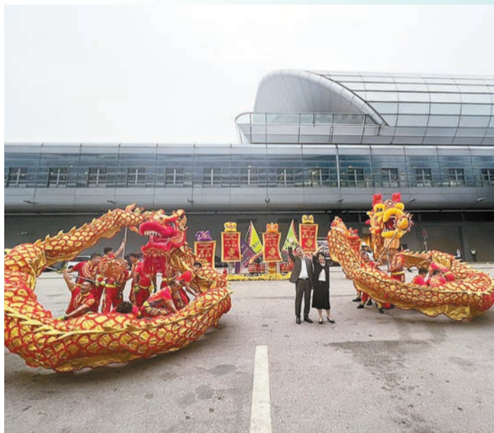
到港郵輪受到熱烈歡迎。

【香港商報訊】記者周偉立報道：昨日及今日共四艘國際郵輪訪港，同時過夜停泊啟德和海運兩個郵輪碼頭，涉及約一萬名旅客，業界均忙於接待，並盡力呈獻香港多元精彩的旅遊魅力和提供貼心具效率的服務。文化體育及旅遊局局長楊潤雄昨早專程前往啟德郵輪碼頭視察，及後在社交平台發文指，今年3月共有20艘來自世界各地的郵輪訪港，提供33個航次和帶來10萬人次的郵輪旅客。