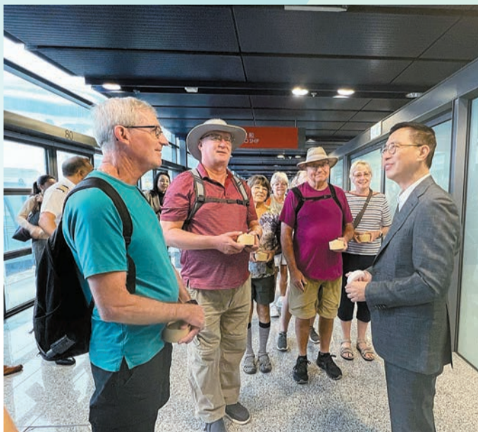
楊潤雄與訪港的郵輪旅客交流。