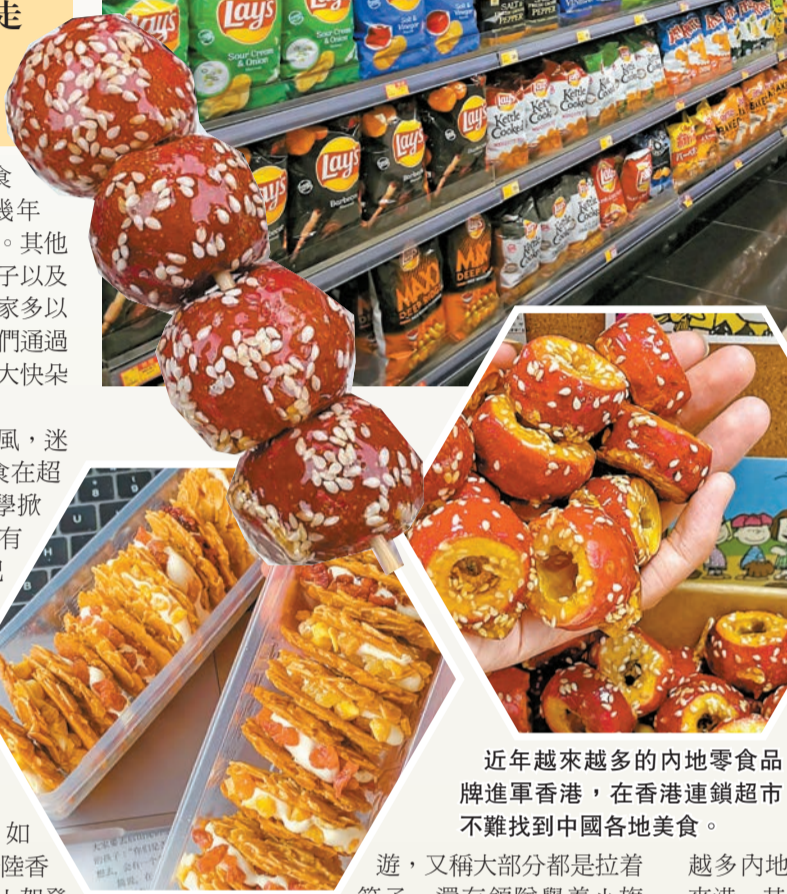
近年越來越多的內地零食品牌進軍香港，在香港連鎖超市不難找到中國各地美食。