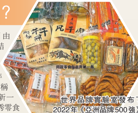
世界品牌實驗室發布了2022年《亞洲品牌500強》排行榜，共有20個國家和地區的500個品牌入選。

不過，食物好不好吃，因人而異，欠缺客觀標準，爭議可以好大。上述的評選排行榜純屬一家之言，僅供大家參考。