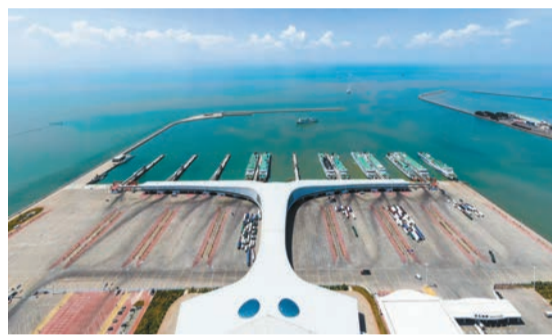
湛江徐聞港。資料圖片

接下來湛江將以《規劃》為藍本，加快制定特色型現代海洋城市建設的「湛江方案」，鑰定階段目標，細化項目任務，不斷讓規劃所刻畫的美好藍圖在湛江大地上早日變成施工圖、實景圖。