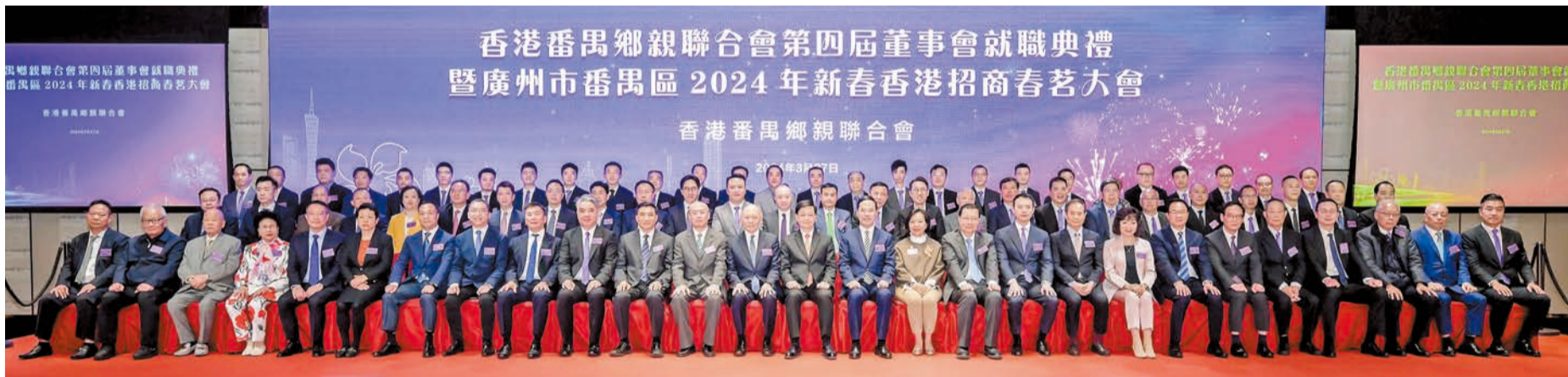
廣州市番禺區在香港舉辦香港番禺鄉親聯合會第四屆董事會就職典禮暨廣州市番禺區2024年新春香港招商春茗大會，賓主合照。

【香港商報訊】3月27日，廣州市番禺區在香港舉辦香港番禺鄉親聯合會第四屆董事會就職典禮暨廣州市番禺區2024年新春香港招商春茗大會，與香港政界、商界知名人士，番禺籍廣州市榮譽市民，旅港番禺鄉親共賀新春、共敘鄉情、共謀發展。香港特別行政區行政長官李家超，外交部駐港公署參贊、領事部主任魏文修，香港特區政府民政及青年事務局局長麥美娟，番禺區委書記黃彪，區委常委、統戰部部長、區政協黨組副書記鄧耀棋，區委常委、區委辦主任鄧展鵬，香港番禺鄉親聯合會會長霍啟文、主席李民強，以及區有關職能部門的領導出席大會。