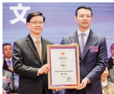
李家超頒發會長委任狀予霍啟文。

這次番禺區到香港不但成功舉辦春茗招商暨鄉親聯合會的換屆就職大會，而且還積極開展訪商、招商活動，現在已經有新鴻基、新世界、華潤集團、榮耀廣場等在番禺投資超1000億元。