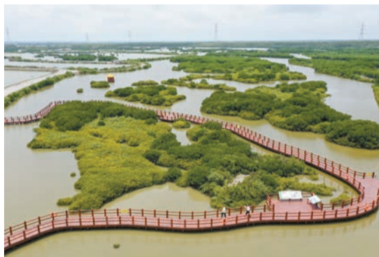
湛江金牛島紅樹林。資料圖片