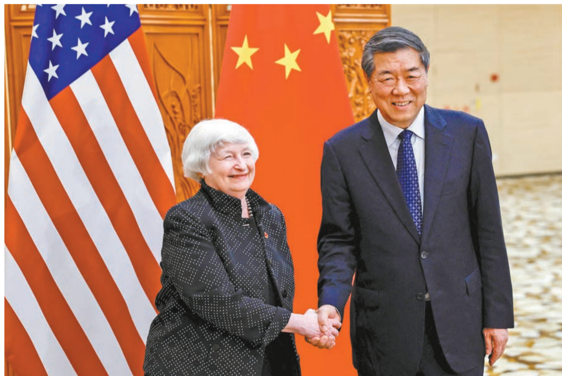
中共中央政治局委員、國務院副總理何立峰（右）在廣州會見美財政部部長珍妮特·耶倫。

王文表示，中美經貿關係應該是兩國關係的穩定力量。中方願與美方共同努力，積極落實兩國元首共識，通過中美商貿工作組加強溝通、擴大合作、管控分歧，為兩國企業開展貿易投資合作營造良好的環境。王文重點就美對華加徵301關稅和相關301調查申請、泛化國家安全、制裁中國企業、修訂貿易救濟調查規則、雙向投資限制、對中國企業不公平待遇等表達關切。