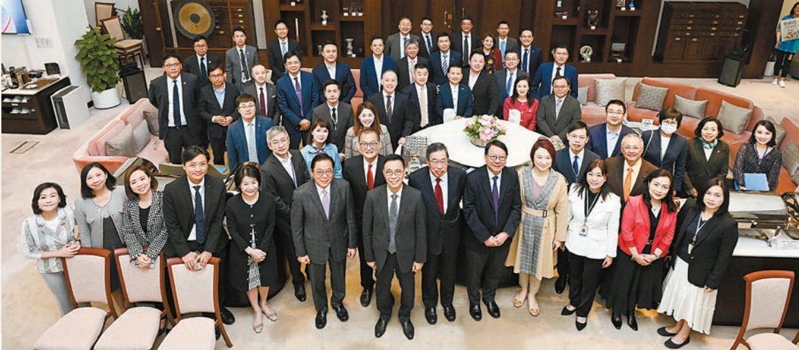
陳國基（第一排右五）、楊潤雄（第一排右七）、盧寵茂（第一排左七）及麥美娟（第三排右二）與議員於會前合照。

【香港商報訊】記者馮仁樂報導：第14次立法會前廳交流會昨日舉行，討論跨境醫療合作、「醫健通+」發展、地區治理、青年事務、旅遊和康樂等議題。政務司司長陳國基分享了三個方面的體會，分別為加強愛國主義教育、加強地區建設和加強醫療協作。文化體育及旅遊局局長楊潤雄、醫務衛生局局長盧寵茂、民政及青年事務局長麥美娟也參與交流會。