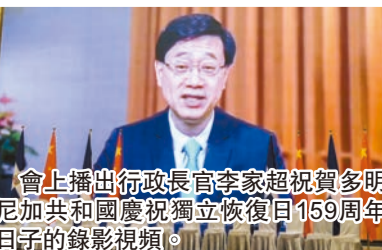
會上播出行政長官李家超祝賀多明尼加共和國慶祝獨立恢復日159周年日子的錄影視頻。