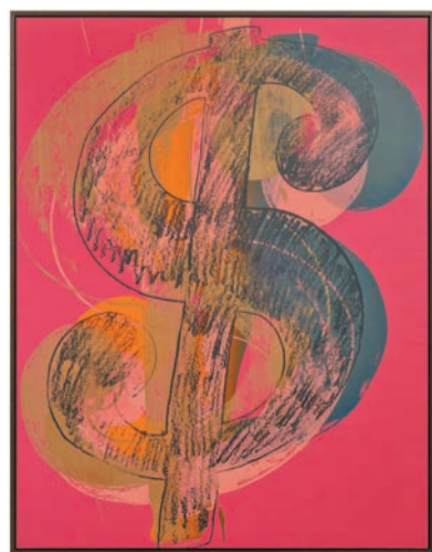
安迪·沃荷作品《美元符號》，1981年。

內容：安迪·沃荷是普普藝術的開創者，對世界藝壇影響深遠。現正舉行的「安迪·沃荷的悠悠長影」展覽展出沃荷的畫作、攝影作品及影片，同場呈現與沃荷同代或新生代藝術家的作品，包括德里克·亞當斯、村上隆、曾梵志等，探究沃荷對文化的影響。沃荷在40年的創作生涯推陳出新，從1950年代個人意義的素描，轉至1960年代以名人、消費品和災難為題材的普普藝術絲網印刷畫作，再到1970年代的社會精英肖像作品，及1980年代創作的電視劇集、合作項目和攝影作品。展品《美元符號》將商業設計和金融標誌引進藝術世界，他不拘一格的創作媒介和形式，至今仍為藝術家帶來啟迪。 文：儀