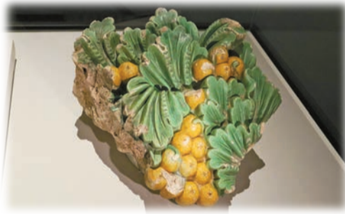
「建築裝飾構件」，約乾隆十二年至四十八年。