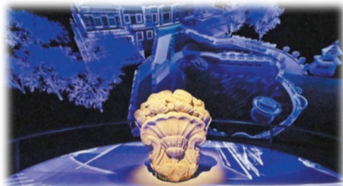
「雕花構件」，約乾隆二十一年至二十四年。