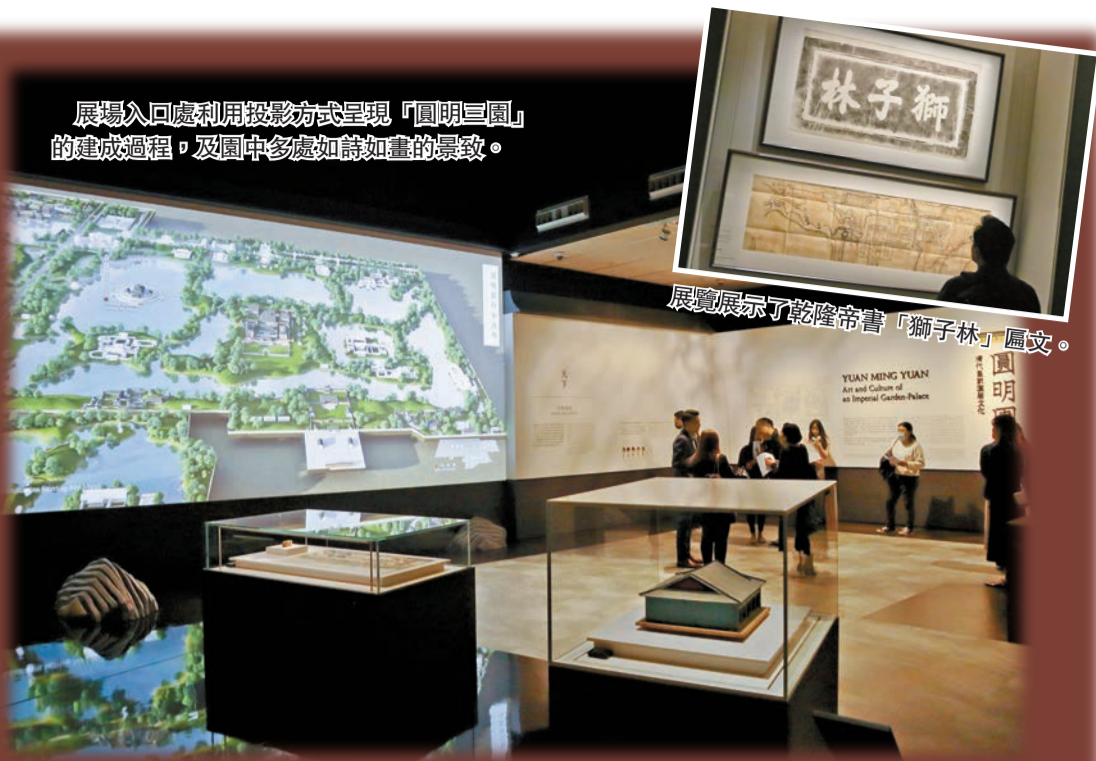
展覽入口處利用投影方式呈現「圓明三園」的建成過程，及園中多處如詩如畫的景致。