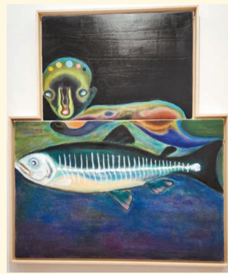
動物形象頻繁出現於展覽中。

內容：日本藝術家加藤泉創造的人形生物怪異且神秘，獨具個人風格。現正舉辦的「加藤泉個展」，展出他近年創作的油畫、裝置及藝術玩具。作品不但蘊含加藤標誌性的人形生物，還融入全新的動物形象與解剖學元素。多件作品採用二元結構，除畫作與雕塑常被分割成兩半外，作品中還常出現男女形象、人與動物、內與外的對立，饒有趣味。藝術家在畫作與雕塑中融入解剖學元素，表皮下的骨骼清晰可見，讓人聯想起生物課堂上的教學模型，耳目一新。 記者：Ruth