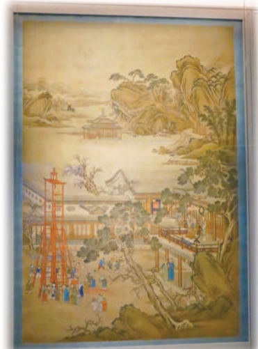
「乾隆帝元宵行樂圖」，約乾隆十五年至二十年。