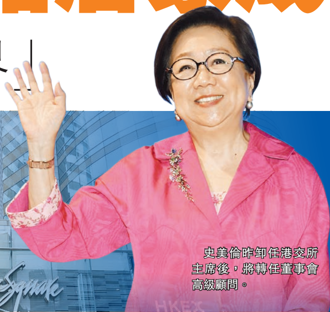
史美倫昨卸任港交所主席後，將轉任董事會高級顧問。