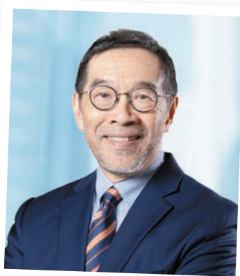
唐家成獲委任為港交所主席。