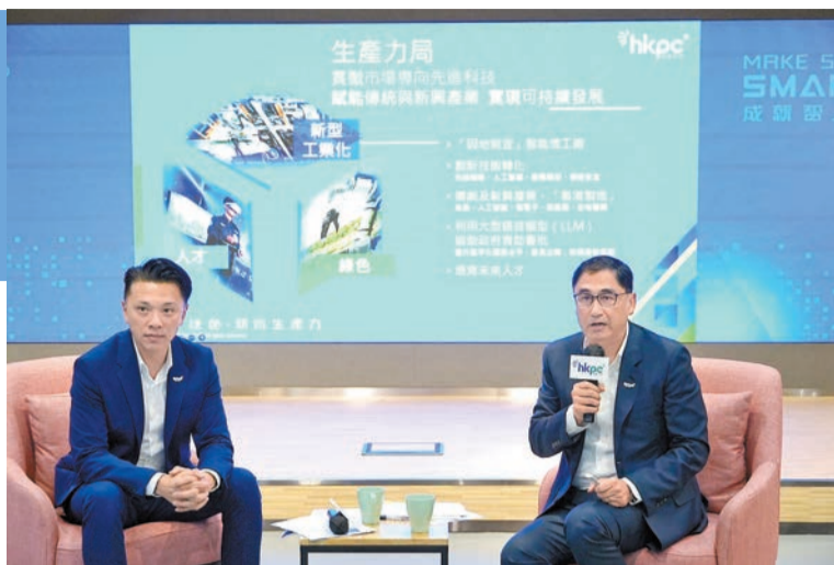
生產力局日前召開記者會講解會如何支持香港工業創新科技發展。圖為生產力局主席陳祖恒（左）和生產力局總裁畢堅文。