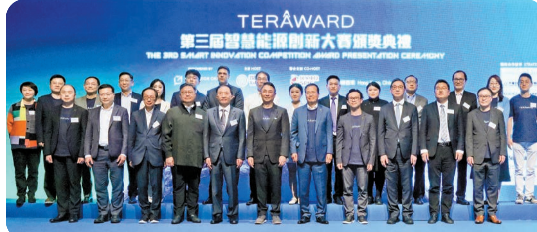
第三屆TERA-Award智慧能源創新大賽來自各地的精英參賽者雲集香港科學園，見證更多零碳科技新力量的崛起。

由香港中華煤氣主辦，國家電投集團聯合主辦的第三屆TERA-Award智慧能源創新大賽頒獎典禮於4月22日「世界地球日」在香港科學園舉行，來自中國的華商廈庚氫能技術（廈門）有限公司的「離網高性能鹼性製氫裝備研發及產業化」項目脫穎而出，榮獲金獎及100萬美元（約780萬港元）獎金。銀獎則由以色列團隊Hydro X獲得10萬美元獎金，銅獎項目深圳市森若新材料科技有限公司獲得獎金5萬美元。