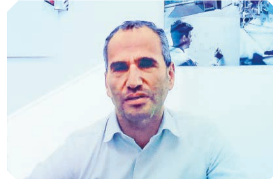
以色列科研團隊Hydro X憑「重塑氫能儲存及運輸」奪銀獎。