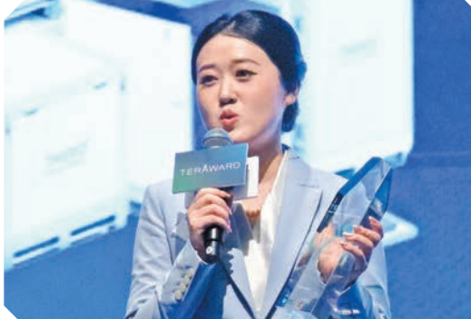
深圳市森若新材料科技有限公司以高效相變材料（PCM）技術取代傳統製冷或熱方法獲銅獎。