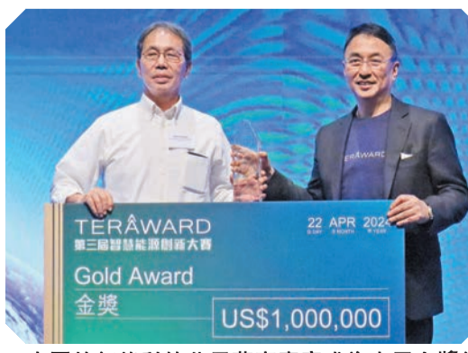
中國的氫能科技公司華商廈庚成為本屆金獎得主，奪得100萬美元獎金。