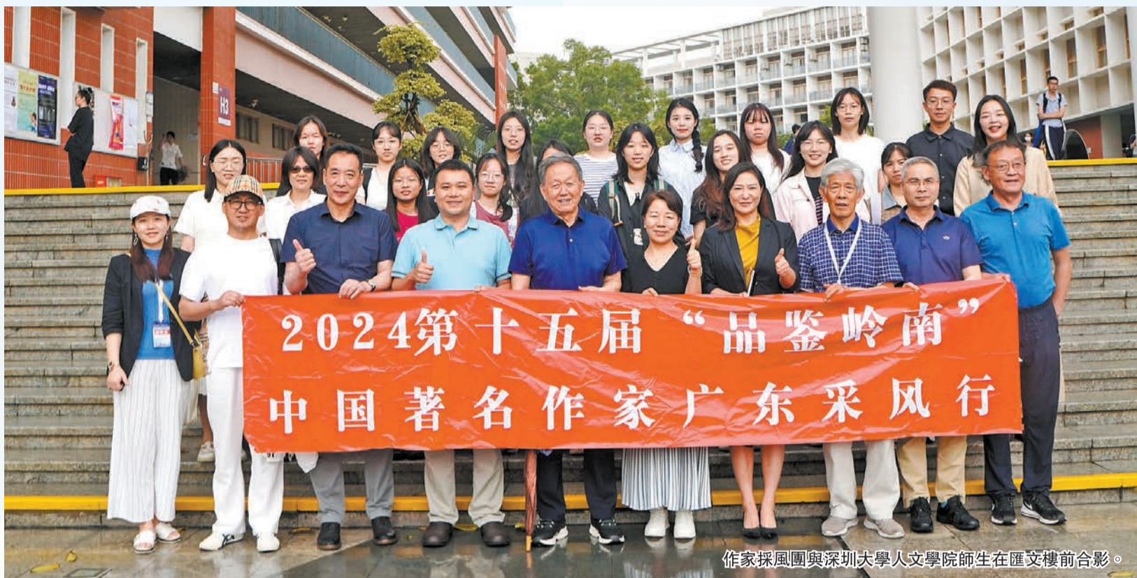
作家採風團與深圳大學人文學院師生在匯文樓前合影。

4月25日，第十五屆「品鑒嶺南——中國著名作家深圳行」採風團走進深圳大學，了解特區高等教育的發展歷程。本次採風團由中國作家協會名譽副主席蔣子龍任團長，成員包括山東省文聯原副主席劉玉民、中國作家協會散文委員會副主任鮑爾吉·原野、電影《甲方乙方》《天下無賊》編劇王剛等中國知名作家，這些作家中有不少是首次參觀深大。在深圳大學的校史館，作家們重溫了改革開放初期的熱血澎湃，並表示深圳大學秉承着深圳特區奮發向上的精神，在年輕而精彩的歷史中書寫了輝煌的篇章。在深圳大學人文學院，作家老師們還參與了該院舉辦的「新時代文學的榮光作家座談會」，與人文學院的師生進行了深度的交流，共同思考文學的未來。流光易逝，一個上午的簡短參觀卻給作家老師們留下了深刻印象。蔣子龍、劉玉民、衣向東等為深大揮毫墨寶留下墨寶以作紀念，祝福深大的未來越來越好。 文/伍敬斌