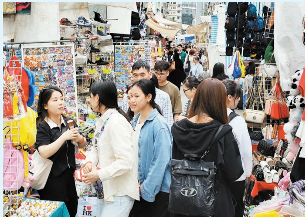
五一黃金周昨日進入第三天，在旺角區有大批旅客逛街購物。

【香港商報訊】記者唐信恒報道：昨日是內地五一黃金周假期第三天，港九各區持續熱爆。尖沙咀星光大道擠滿觀光人潮，大批旅客爭相「打卡」自娛；不少旅客到中上環一些「打卡地」集郵拍照，在西區堅尼地城海旁和中環到處都出現排隊的情況；旺角街頭也有大批旅客購物和大吃大喝，滿載而歸。內地客鍾愛體驗「港式文化」可見一斑。