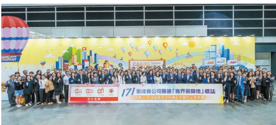
長江集團已連續21年成為最多成員公司獲頒發「商界展關懷」標誌的企業集團。

【香港商報訊】記者周偉立報道：長江集團成員一向熱心公益，該集團昨日公布，旗下合共171家成員公司今年獲香港社會服務聯會頒發「商界展關懷」標誌，已連續21年成為最多成員公司獲得此項殊榮的企業集團。