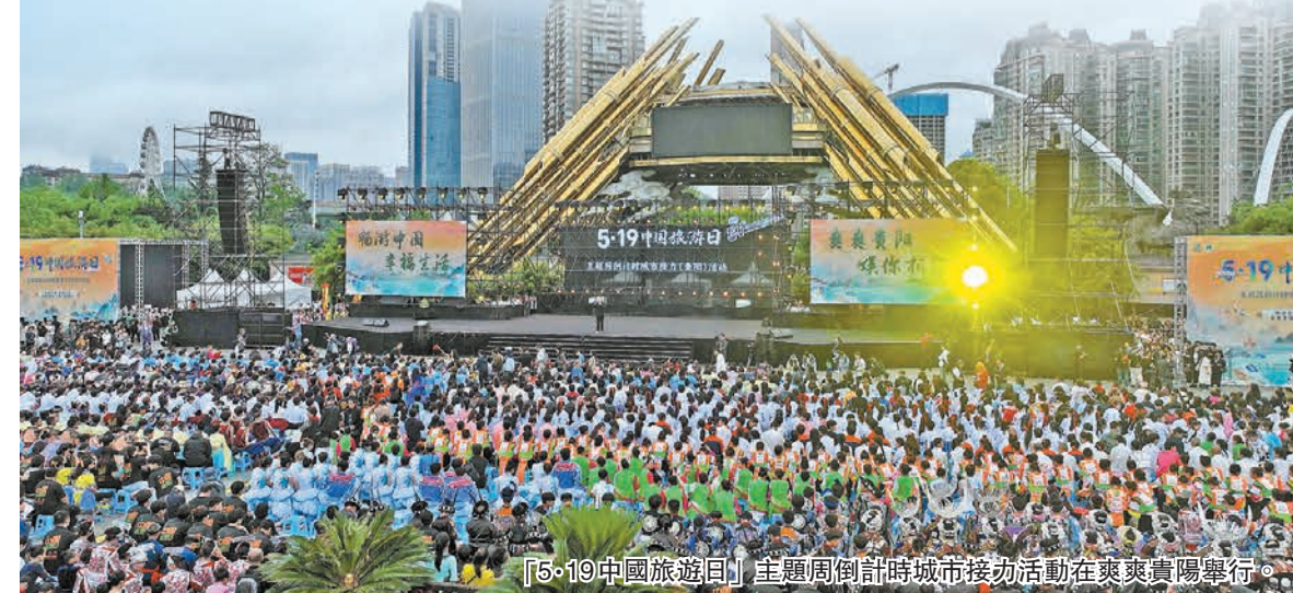
「5·19中國旅遊日」主題周倒計時城市接力活動在爽爽貴陽舉行。

今年，文化和旅遊部首次以城市接力的形式在全國範圍內遴選六座城市開展主題周倒計時活動。經