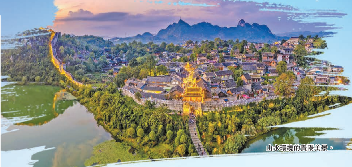
山水環繞的貴陽美景。