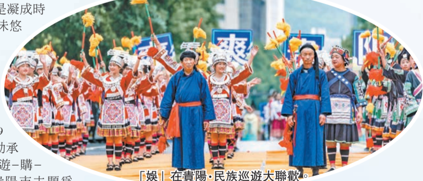
「娛」在貴陽·民族巡遊大聯歡。

貴陽市積極申報，成功入選與潮州、瀋陽、石家莊、寧波、鄂爾多斯共同作為2024年「519中國旅遊日」主題周倒計時活動承辦城市，依次以「吃—住—行—遊—購—娛」為主題開展活動，其中貴陽市主題為「娛」。