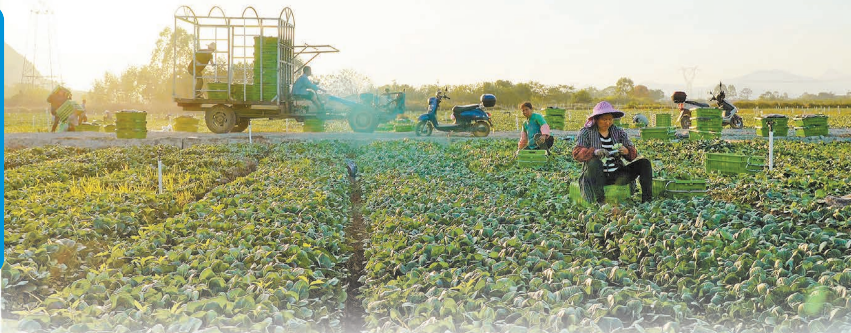
圖為工人們在鍾山縣東融（供港）稻菜基地採收斗白菜。