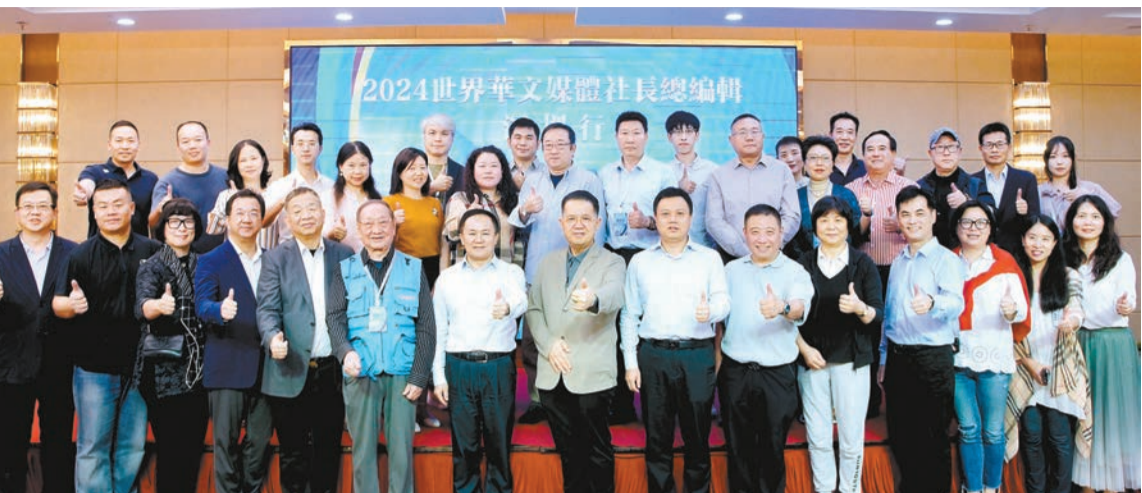
「2024世界華文媒體社長總編輯深圳行」活動啟動儀式合影。

主辦：深圳市人民政府新聞辦公室 承辦：香港商報 時間：2024年5月 們將參觀「無界——深港澳青年藝術大展」「文化產業綜合展」和深圳館等，沉浸式挖掘文博會亮點。作為中國國家級、國際化、綜合性文化產業博覽交易會，文博會自2004年創辦以來，已經成為展示文化改革發展成果、促進中外文化交流合作的亮麗名片。來自五大洲的華文媒體社長總編輯們將通過全球視野解讀中國文化產業的發展。