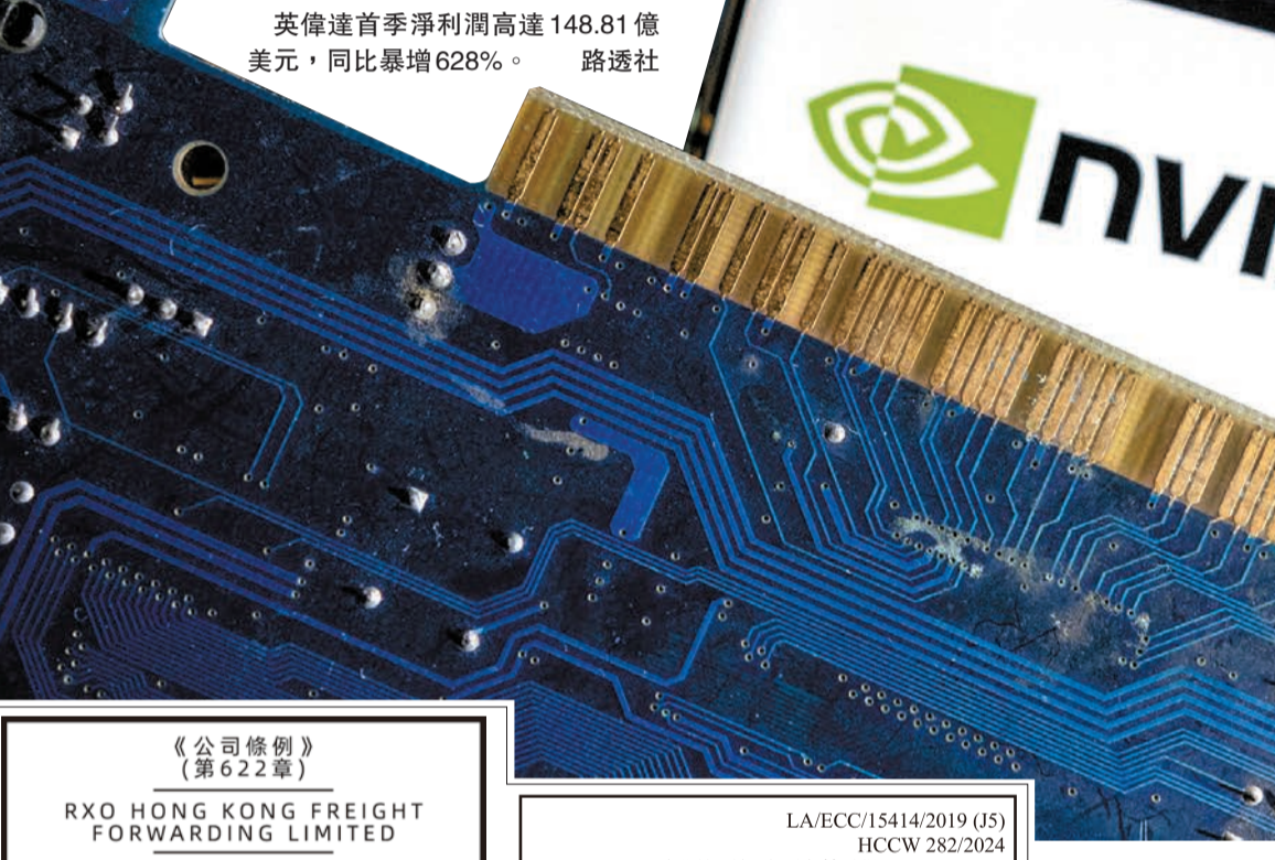
英偉達首季淨利潤高達148.81億美元，同比暴增628%。

儘管目前絕大多數《華爾街早餐》的訂閱者認為，出版商在使用AI時應附上免責聲明，但隨着技術的發展和應用，這一要求是否會發生變化，還有待觀察。