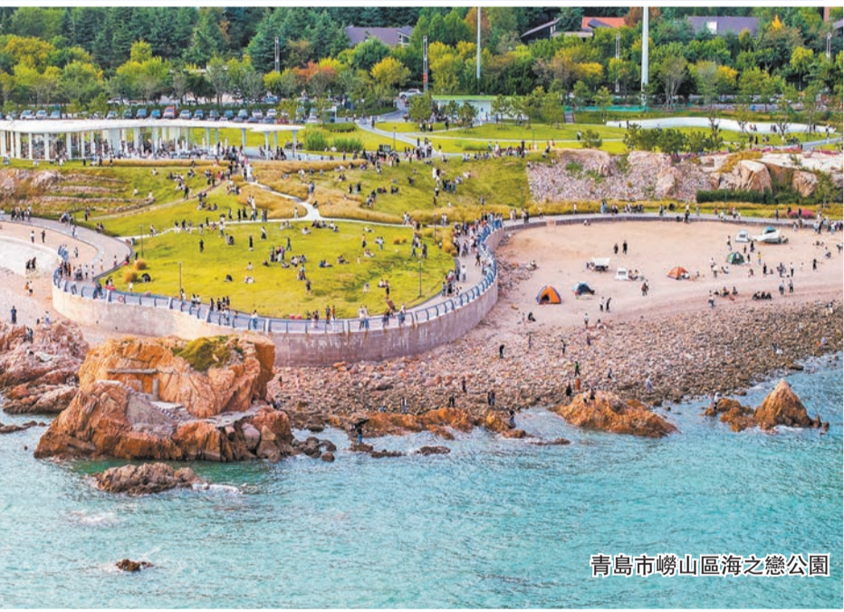
青島市嶗山區海之戀公園

輪上市政策，建立推進企業上市綠色通道服務機制，為企業上市提供「全生命周期」的服務生態，全方位營造良好的發展環境。