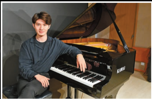
牛牛2014年獲全額獎學金入讀美國茱莉亞音樂學院，2018年畢業，同年通過優秀人才入境計劃獲得香港身份。

蓋上琴蓋，牛牛一樣多才多藝。「我不僅要變成全能音樂人，也希望成爲一個更全面的人。」除了每天練琴6小時，牛牛會抽時間培養不同愛好。大學時期，他愛上做甜點，提拉米蘇、馬卡龍、麵包蛋糕等樣樣拿手。「做甜点和炒菜不