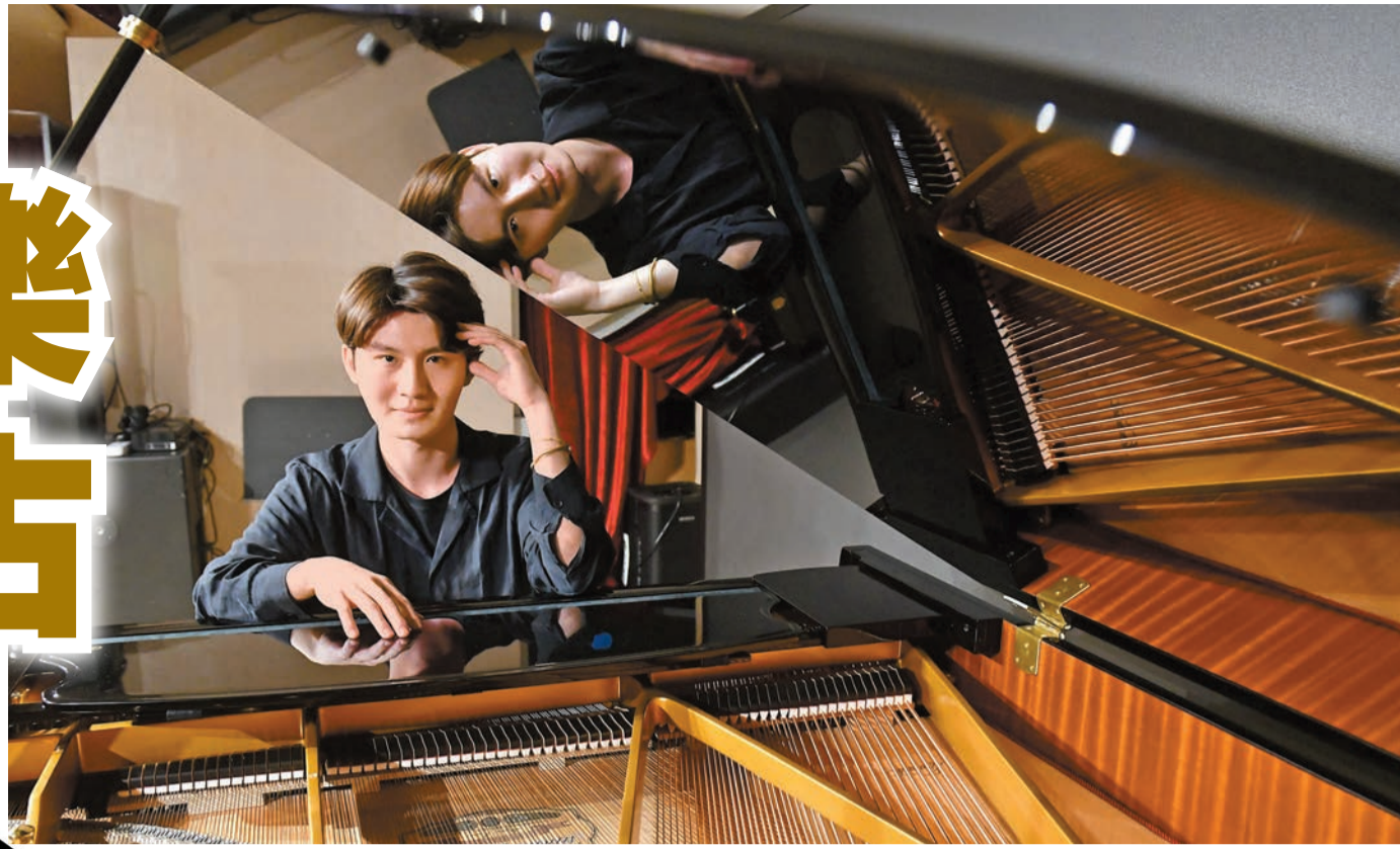
▲充滿表現力的牛牛笑言自己會像歌舞演員一樣進行「表情管理」。