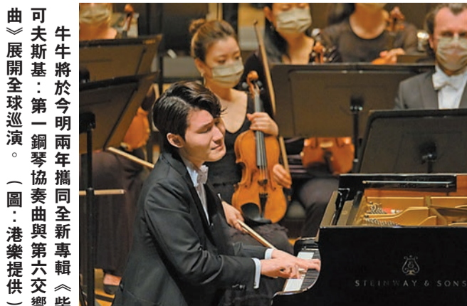
牛牛將於今明兩年攜同全新專輯《柴可夫斯基：第一鋼琴協奏曲與第六交響曲》展開全球巡演。