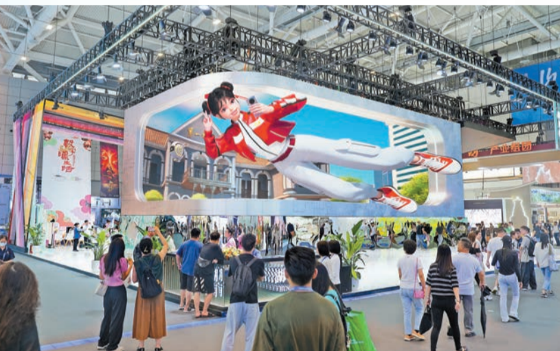
在湖南展館，裸眼3D視頻「魅力湖南」以卡通人物的視覺奇觀展開。

湖南館外牆上，一塊巨幅裸眼3D屏幕成爲了一道靚麗風景線。屏幕上播放的裸眼3D短片《魅力湖南》，以視覺奇觀、城市遊歷、底蘊故事展開，精選第一師範、愛晚亭、嶽麓書院、橘子洲頭等地標景點，爲觀衆呈現了一幅厚重悠長的湖南歷史文化畫卷。