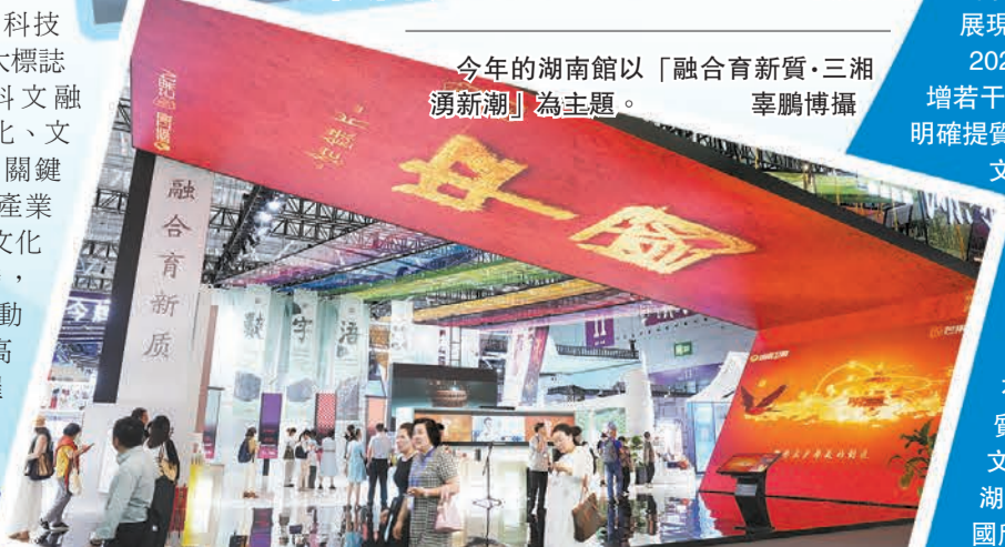
今年的湖南館以「融合育新質·三湘湧新潮」為主題。