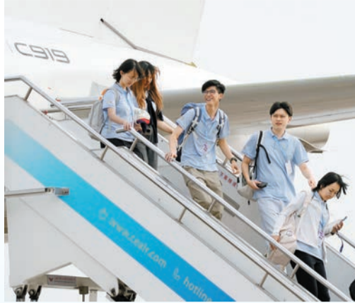
乘坐C919飛抵上海的香港青年學子走出艙門。