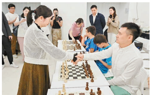
譚中怡(左)與國際象棋愛好者比賽。

譚中怡在座談會上分享了她在國際象棋生涯中的各種故事，以及一路走來的心路歷程。她希望年輕選手積極參加比賽，與世界各地優秀選手交流切