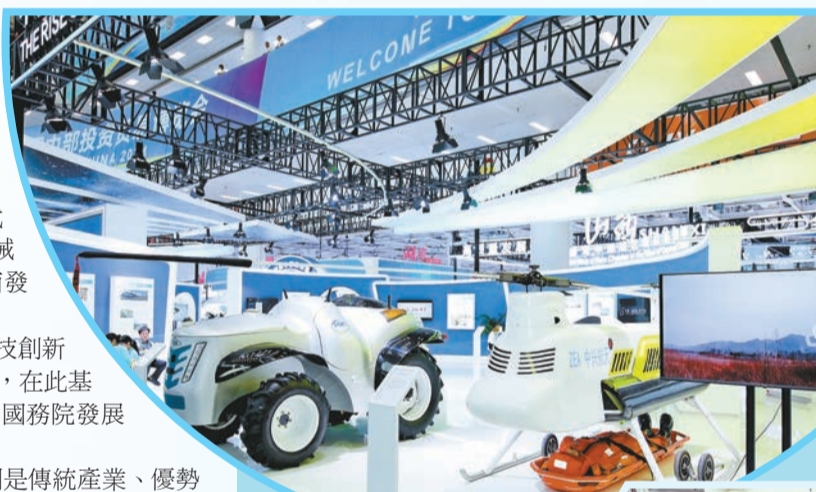
▲中部博覽會匯聚展示了許多高精尖產品。

米，吸引了參展企業1000餘家、專業採購商1400餘人。有來自美國、俄羅斯、德國、英國、韓國、中國香港等32個國家或地區的商品參展，極具國際影響力。