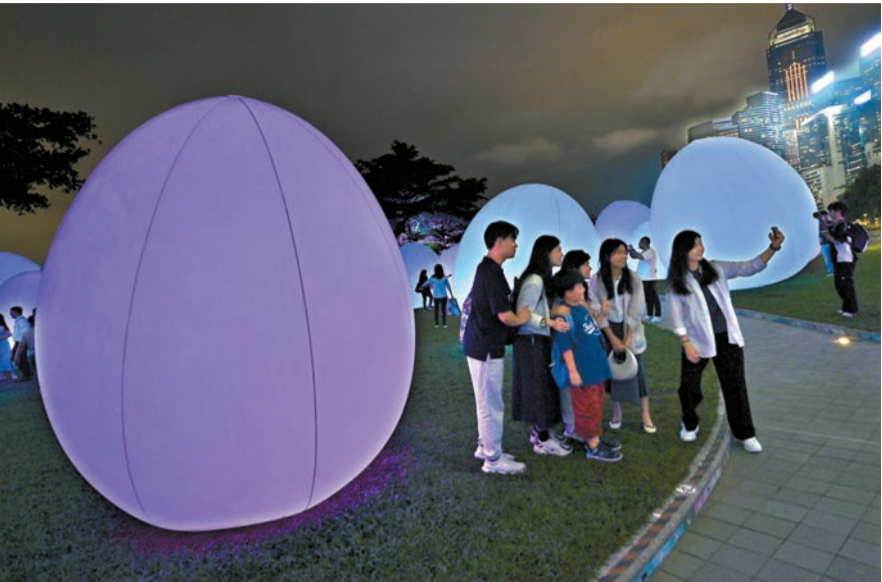
「teamLab：光連」非常受歡迎，展覽期間吸引大批市民及旅客拍照留念。