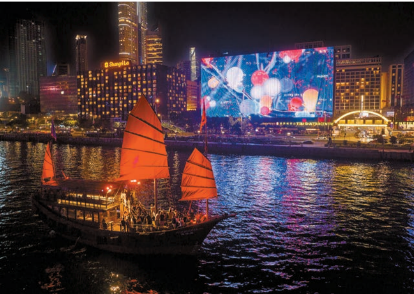
信和集團與本地藝術組織HKWALLS合作呈獻的《流動光影》，令維港添色。

【香港商報訊】記者戴合聲報導：由康文署主辦的大型戶外藝術計劃「藝術@維港2024」已於6月8日圓滿結束。組成計劃的5個藝術項目自3月底開幕以來，廣受本地市民及旅客歡迎。在添馬公園及中西區海濱長廊（中環段）舉行的「teamLab：光連」和「藝術有理」展覽，共錄得超過130萬人次參觀，當中約兩成為旅客。根據合作夥伴提供的統計資料，尖沙咀方面的3個項目，包括K11集團與佩斯畫廊合作的Alicja Kwade《世界的秩序（圖騰）》雕塑、信和集團與本地藝術組織HKWALLS合作呈獻的《流動光影》，以及領賢慈善基金與梵高文化遺產基金會攜手合作籌劃，並由文化體育及旅遊局「文化藝術盛事基金」項目計劃資助的「梵高·樂印」，均分別錄得超過200萬人次參觀。