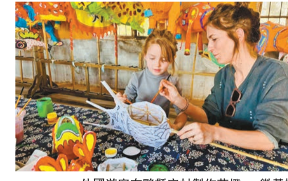
外國遊客在黟縣宏村製作花燈。

傳統節日的濃厚文化內涵與旅遊發展深度融合。端午假期，黃山各地紛紛推出特色活動、新型消費場景和惠民措施，豐富群眾文化和旅遊生活。其中，屯溪區在屯溪老街、屯溪河街、黎陽老街開展2024「新安月夜·豔見端午」龍舟晚會，涵蓋非遺民俗巡遊、演、龍舟晚會等內容，吸引了不少遊客駐足觀賞。徽州開闢「民俗端午」特色長桌宴，欣賞跳鍾馗、漁翁戲蚌、柳翠娘等非遺民俗表演；「曲藝端午」讓民衆領略舞獅、鼓舞、雜技等傳統文化魅力；「詩韻端午」詩詞大會盡顯文化氣息，徽州民俗與端午文化巧妙結合。黟縣域內古韻秀里邂逅李白、打鐵花、熱氣球、草環民謠音樂會、秀里遊園會、多巴胺市集、篝火晚會、帳篷露營等活動讓遊客樂享「端午拾光」。