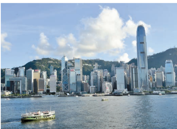
香港生活成本高昂，對所有香港人都是一大挑戰。

【香港商報訊】記者宋小茜報道：人力資源管理諮詢公司美世(Mercer)發布《2024年全球生活成本排名》，香港、新加坡、蘇黎世成為跨國工作僱員生活成本最貴的城市，排名與2023年相同，主要反映在住屋、運輸、商品和服務成本較高。調查是基於每個城市逾200項商品的相對價格，並以美元計價為基礎，而作出相關排名。