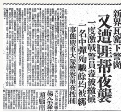
1949年5月18日報章報道瓦窩下警崗殺警奪槍新聞。

再於5月17日晚上，位於邊境內的瓦窩下警崗，發生被十餘名武裝匪徒圍攻。事發時，瓦窩下警崗由一名警目帶領三名警員駐守，當時警目422號負責在警崗下的村屋處站崗，其餘三名警員在警崗內當值。晚上約8時半，突然有一群十餘人的武裝悍匪，相信是由深圳河華界涉水越境，兵分兩路襲擊警察，目標是劫掠警察軍械。首先向警目422號槍射擊，身中五六槍當場斃命；另一群摸到警崗將三名警員制伏，劫去警方的手提輕機槍一挺、長槍兩支、子彈一批，