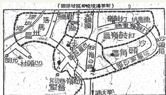
1949年6月4日報道新界邊境戒嚴區域詳圖。

40餘人武裝匪黨時，在一輪激烈槍戰和手榴彈襲擊中，雙方互有死傷。軍方將匪首等人擊斃，並拘捕三男一女匪徒。後來在匪窩檢獲香港瓦窩下警崗案中一批失槍，包括機關槍一挺、步槍兩支、左輪手槍一支，其後交回香港警方。該四名被捕男女匪徒，於5月25日被槍決。