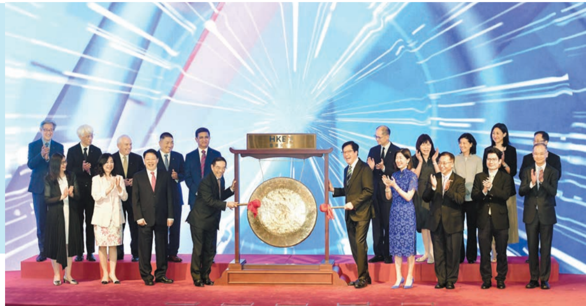
下周四(27日)為港交所上市24周年，港交所主席唐家成(前排左四)昨日呼籲業界齊心協力，抓緊機遇。

【香港商報訊】記者鄭偉軒報道：下周四(27日)為港交所(388)上市24周年，今年4月出任港交所主席的唐家成昨日於慶祝上市24周年酒會上表示，中證監較早前推出的五項新措施，對港股有很大幫助，支持了香港股票市場的發展，及香港作為超級聯繫人的角色。唐家成續稱，未來港交所一定會繼續加強內地與國際市場的交流與聯繫，同時鞏固香港在「互聯互通」的優勢。他透露，現正審理的上市申請有約110宗，較去年下半年增加約五成，看好本港IPO前景。