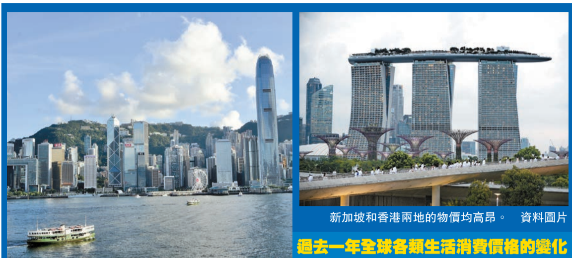
新加坡和香港兩地的物價均高昂。 資料圖片

亞太地區擁有該指數中最昂貴的兩個城市—新加坡和香港。新加坡位居全球最昂貴城市，也是擁有汽車成本最高的地方。香港則是聘用律師最昂貴的城市，