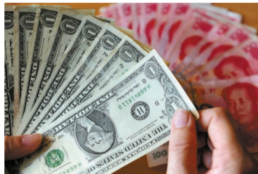
美元全球霸權快將結束。