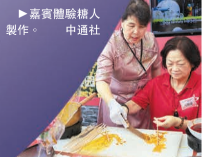
▶嘉賓體驗糖人製作。