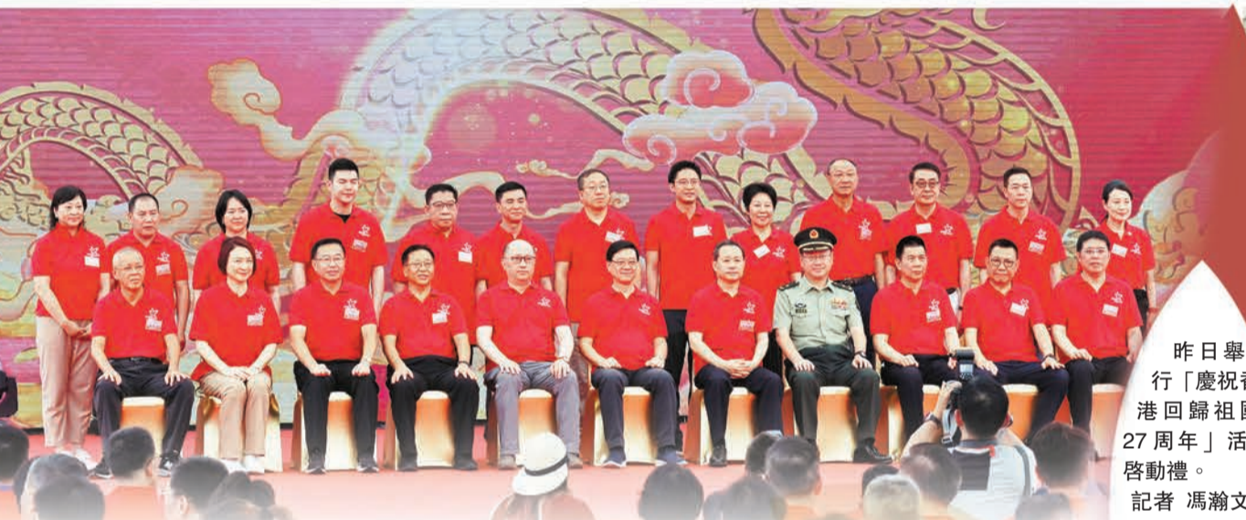
昨日舉行「慶祝香港回歸祖國27周年」活動啟動禮。