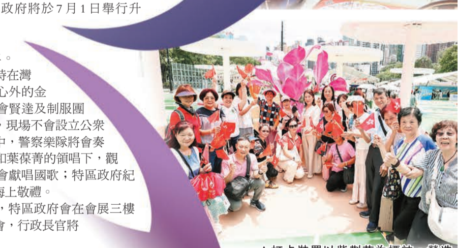
▲打卡裝置以紫荊花為標誌，營造節日浪漫氣氛，寓意香港與祖國緊密相連。