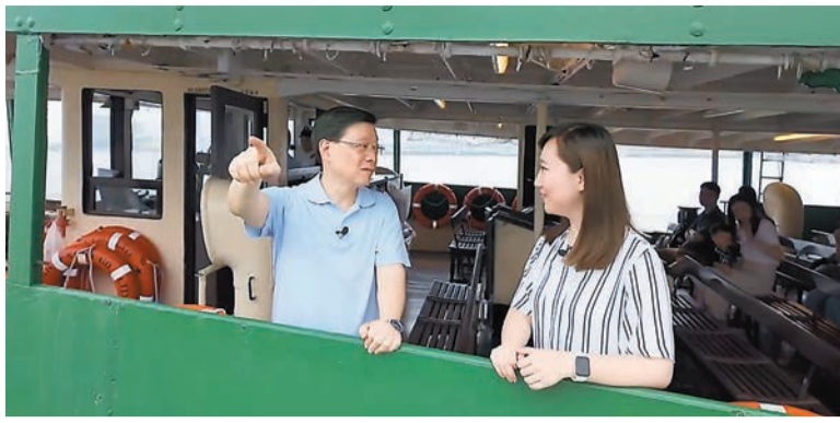
李家超在fb發布工作回顧影片。影片截圖

至於經濟方面，現屆政府為樓市「撒辣」，令樓宇買賣登記大幅回升、樓市穩定發展，以及大規模招商引資。政府又在全港18區舉辦日