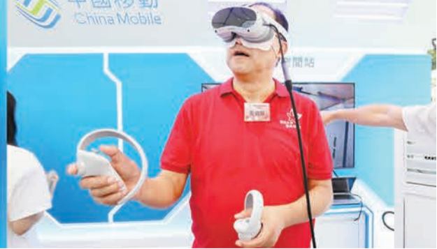
現場展區分6個主題，有不同形式的展覽和表演。

企業核心競爭力，加快推進企業創體系布局優化，更希望通過互動式的體驗，增強市民對航空科技的興趣，激發青少年探索宇宙奧秘的好奇心。