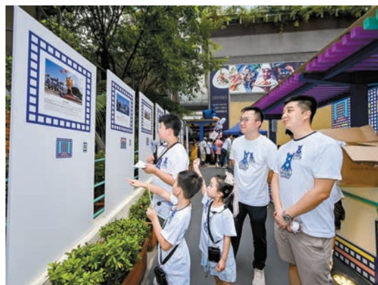
由青年導賞員向市民和遊客介紹灣仔的發展。