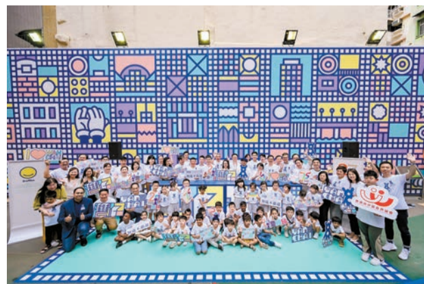
「灣仔四感社區客廳」，全場大合照。