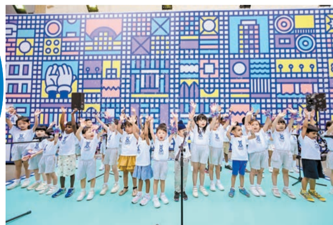
幼稚園學生精彩表演。