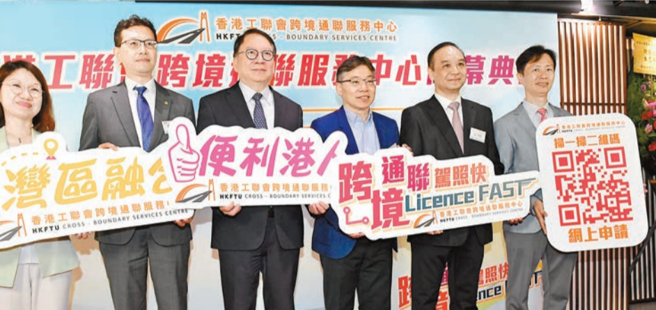
工聯會跨境通聯服務中心昨日舉行開幕禮。

陳國基透露，在中心親身試過一次程序，覺得非常方便，負責體檢的醫生很友善，驗眼安排很貼心。隨着內地和香港在新冠疫情後全面通關，他認為可加強粵港兩地往來，而兩地政府致力加強大灣區互