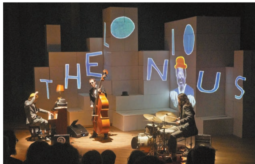
《爵士號飛車》適合6歲或以上小童觀看。