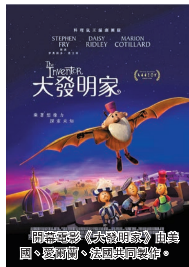
開幕電影《大發明家》由美國、愛爾蘭、法國共同製作。

► 噤梭爵士樂團以生動琴音配以幽默動畫及影像，回顧爵士樂鋼琴家Thelonious的音樂人生。