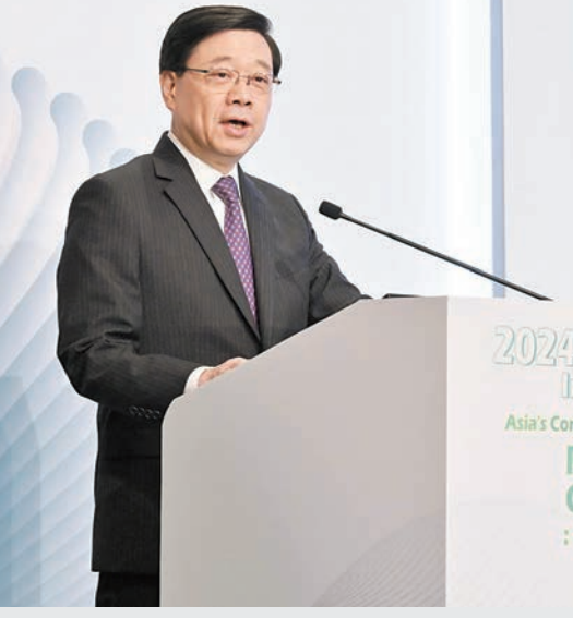
行政長官李家超在2024國際法論壇致辭。