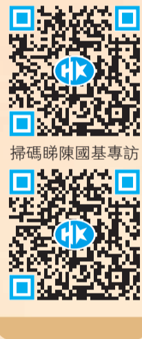
掃碼睇陳國基專訪

完善選舉制度後，區議會、三會（分區委員會、地區撲滅罪行委員會、地區防火委員會）成了強大的諮詢組織，當中收集到的民意會向地區治理領導委員會報告；當局研究後，將針對先後性推出不同政策回應市民訴求。陳國基指出，「政務司司長級別直接領導民政工作，做到上呈下達、下呈上報，相信對地區治理工作更有效用，能更快反映市民需要。」同時，他亦讚揚新的區議會達到目標，470名區議員愛國愛港，工作不再政治化，完全聚焦於服務市民；關愛隊也幫助良多，如已完成13萬次家訪和13000項安排，在風災、水浸等突發情況下與政府部門的合作良好。「很開心，區議會、三會、關愛隊的運作，整體達到社區治理的要求！」他說。